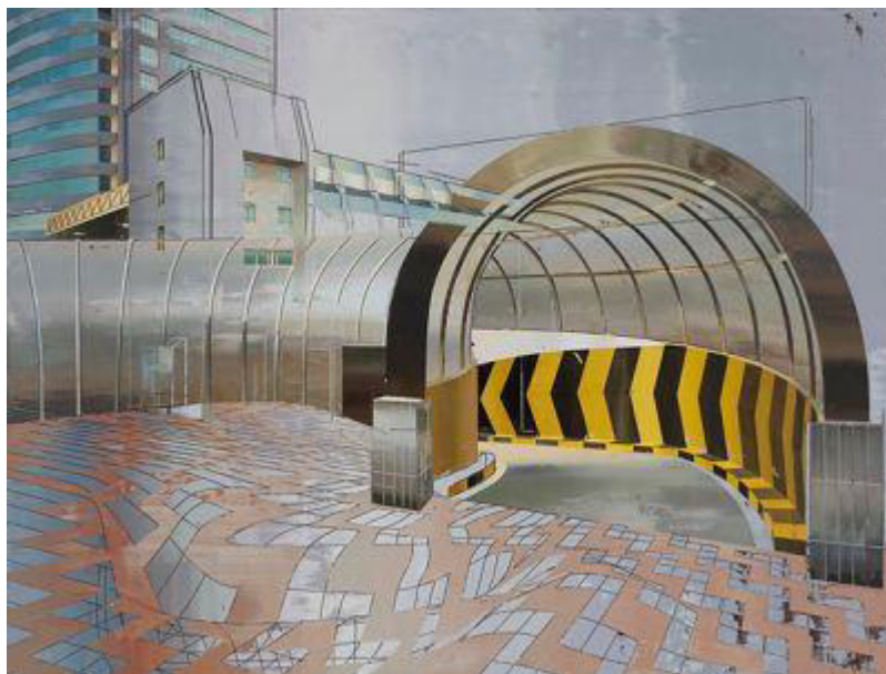
Cui Jie, Entrance to parking, oil on canvas, 2014