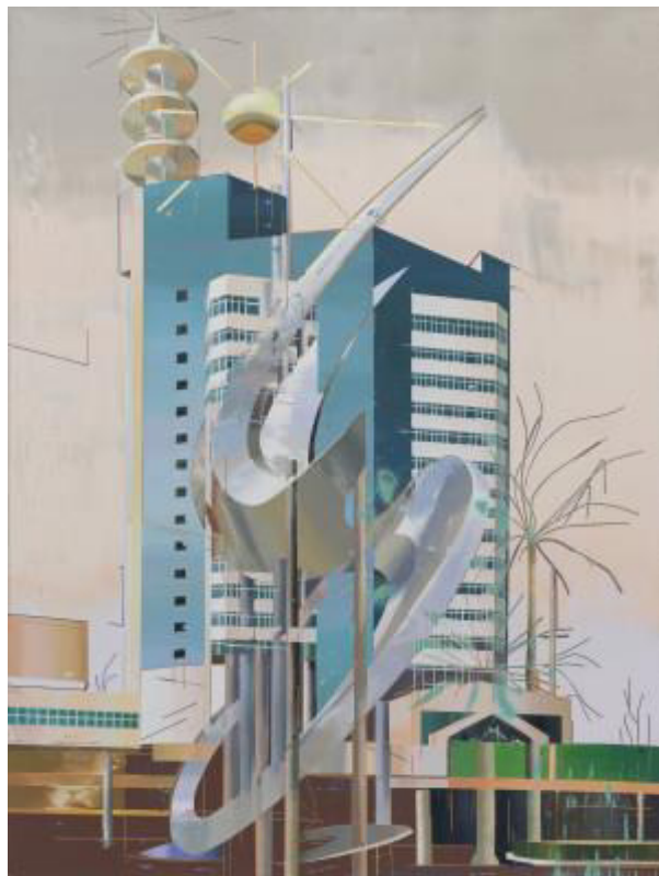
Cui Jie, S's House # 2, oil on canvas, 2015