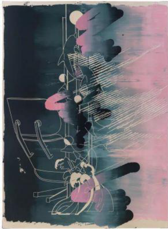
Cui Jie, Series works with no series, oil on canvas, 2018