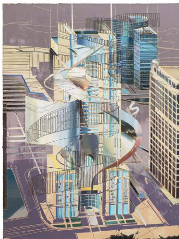
Cui Jie, Shanghai bank tower oil on canvas, 2017

Cui Jie est une jeune artiste contemporaine chinoise, rapidement apparue comme l'une des nouvelles figures les plus intéressantes de l'art contemporain en Chine avec ses peintures et superpositions sur toile de sculptures architecturales. Elle est présentée par la Phaidon Press's publication Vitamin P3 comme un (e) des peintres majeurs en Chine actuellement.