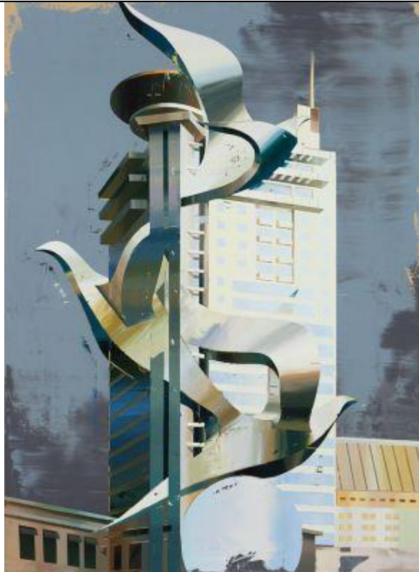
Cui Jie, Building of Doves, oil on canvas, 2014