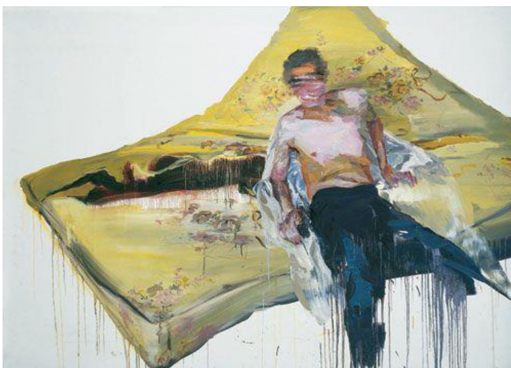
Cui Jie, Works with No Series, 2006

ci-après une sélection des œuvres de Cui Jie :