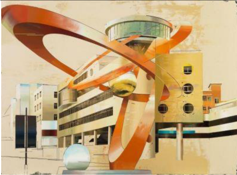
Cui Jie, Dongguang's Workers cultural Palace, oil on canvas, 2014