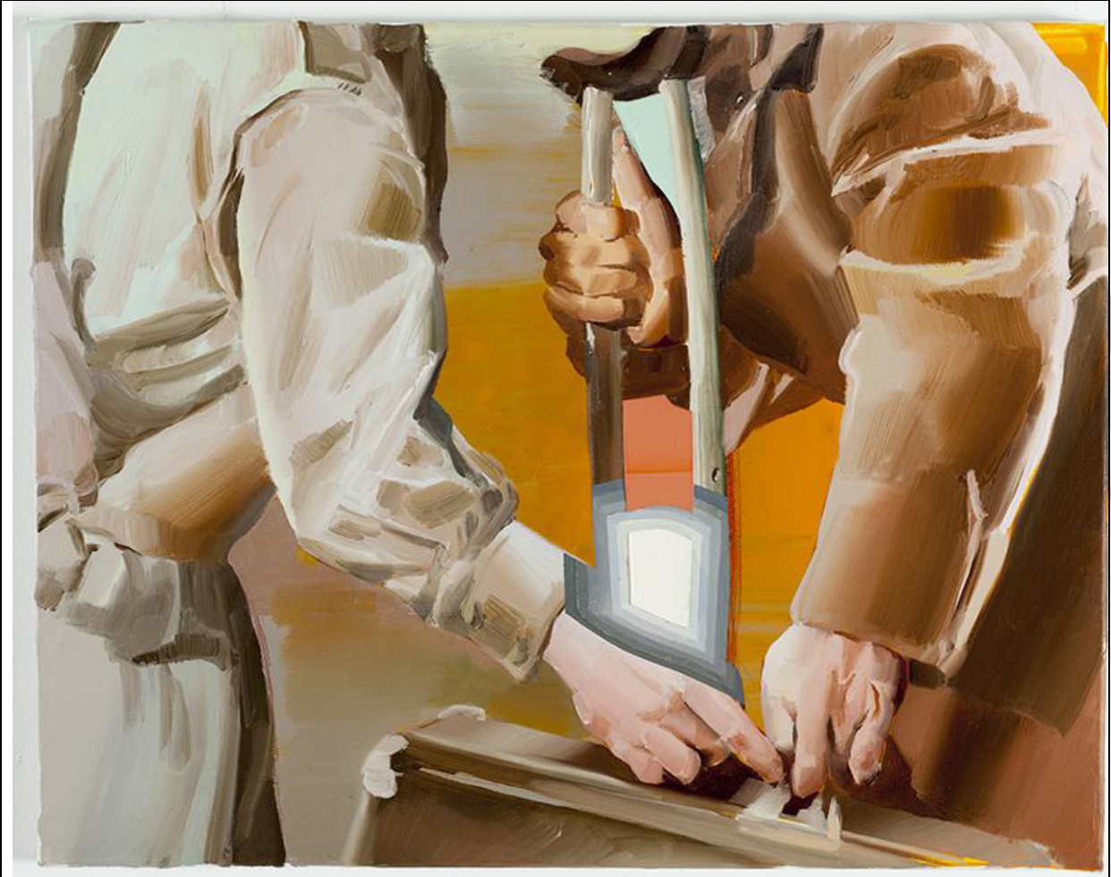
Cui Jie, Ground Invading Figure, oil on canvas, 2012, Leo Xu Projects