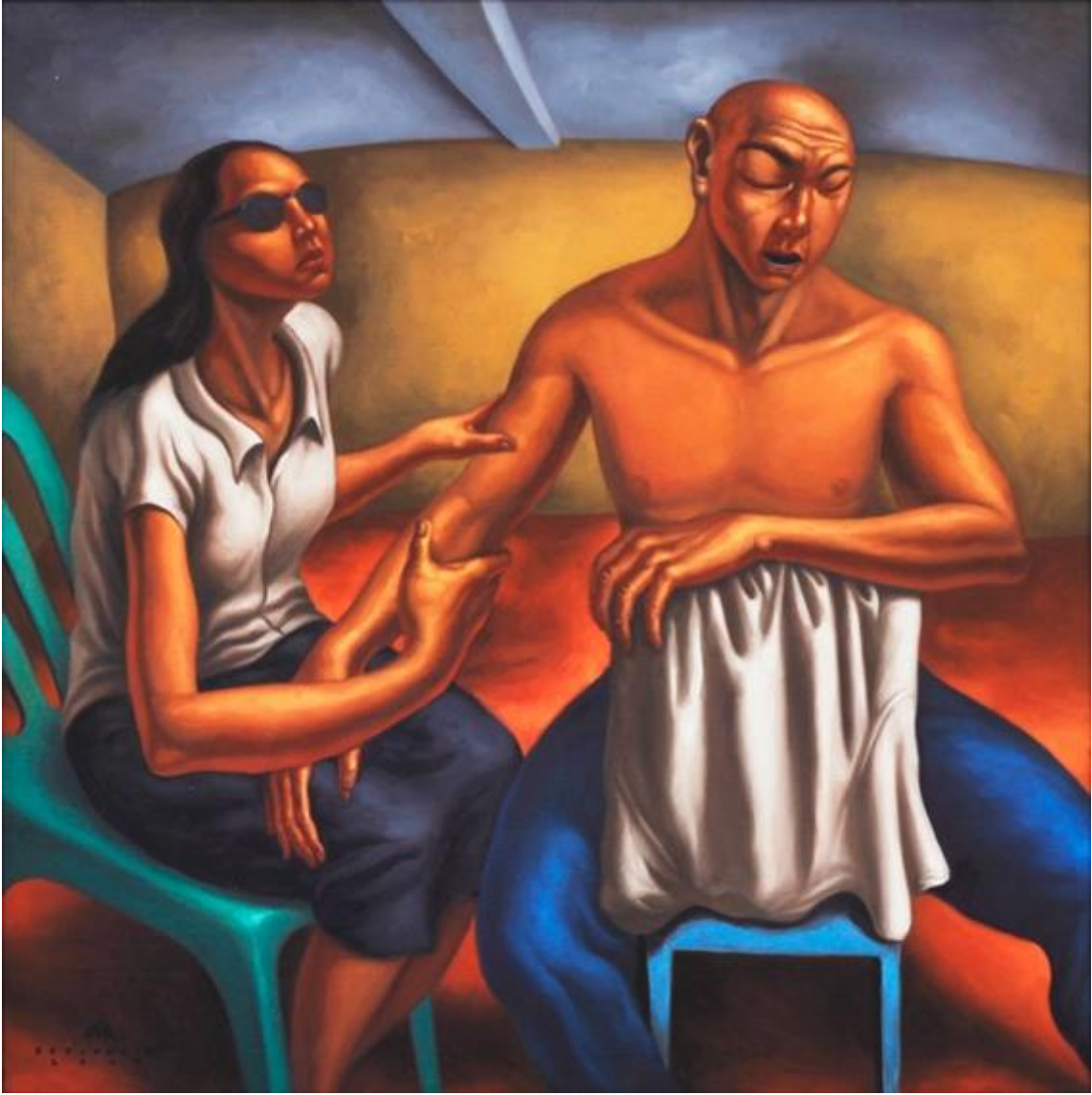
Elmer Borlongan, Mega Touch, oil on canvas, 2009