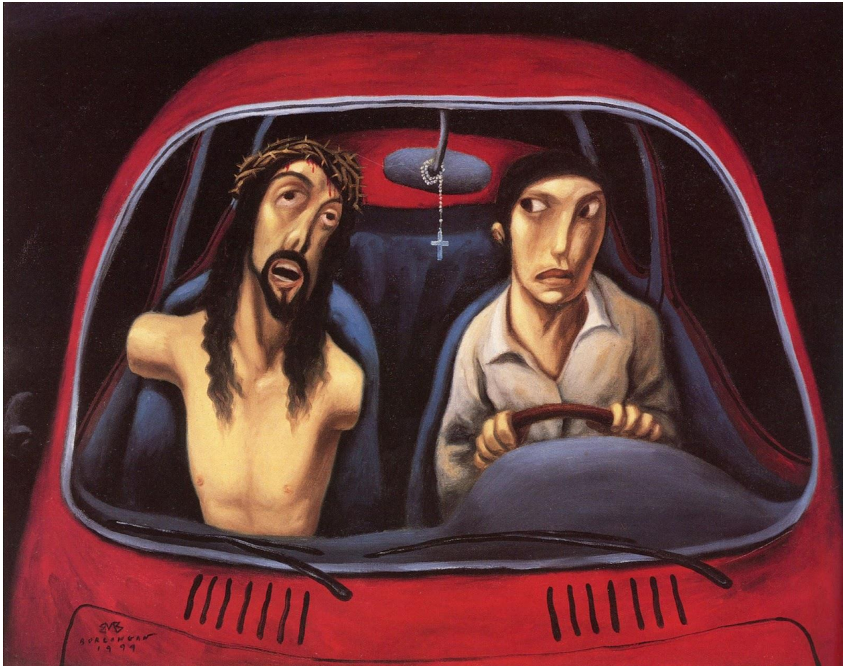
Elmer Borlongan, Gabay, oil on canvas, 1994