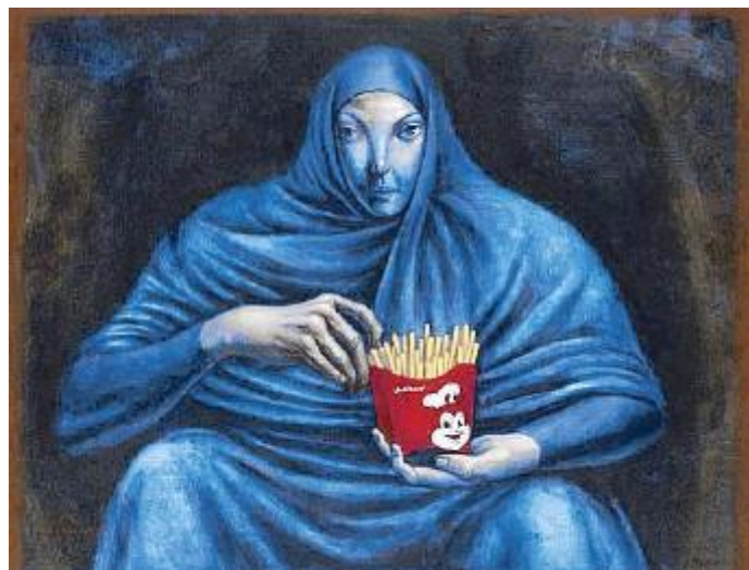
The happiest place on earth, oil on canvas, 2017