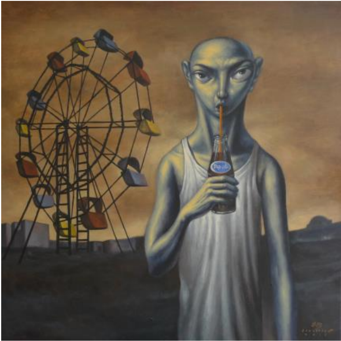
Elmer Borlongan, popcola kid, oil on canvas, 2013, image of the artist