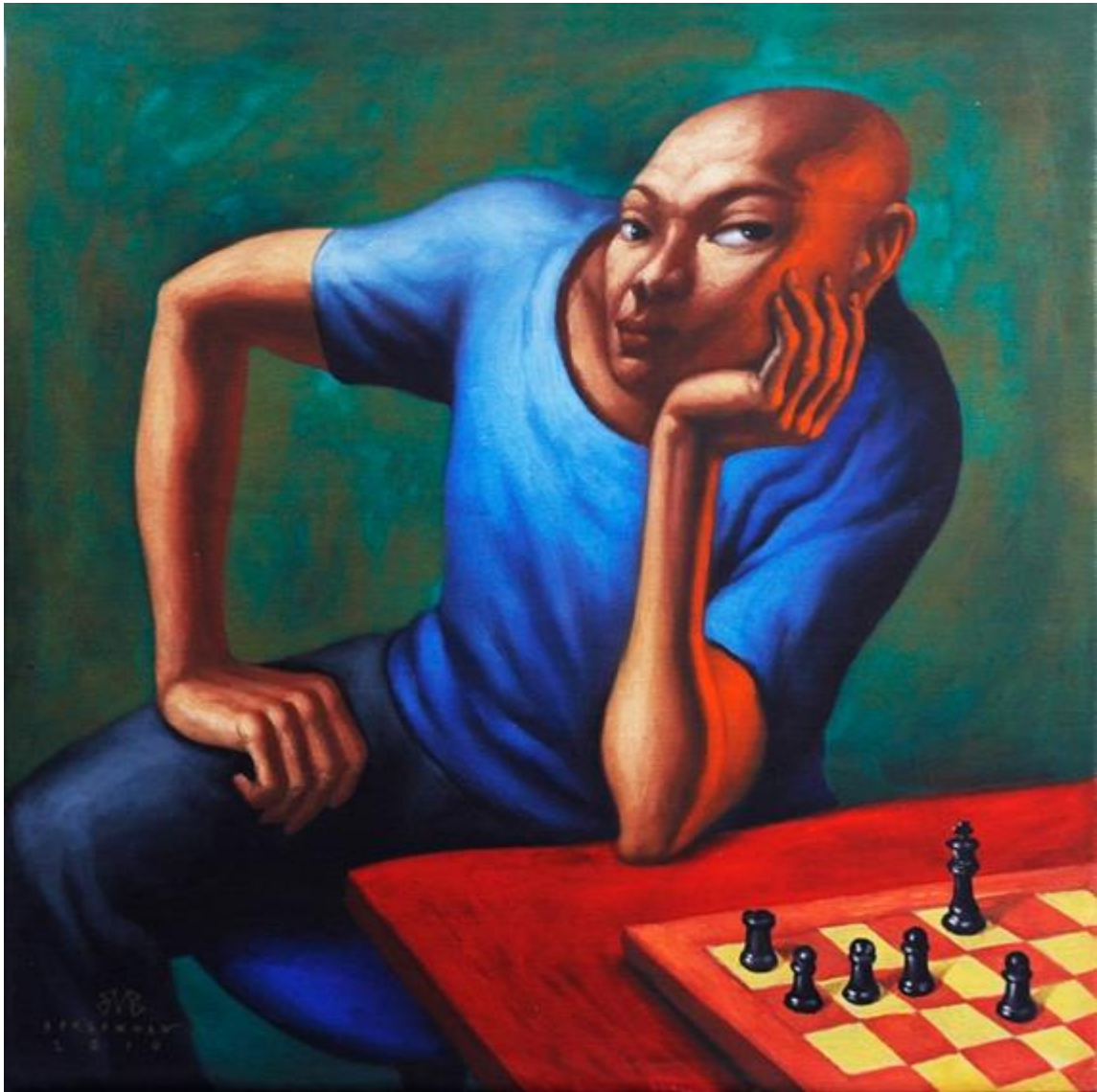
Elmer Borlongan, Untitled, oil on canvas, 2010