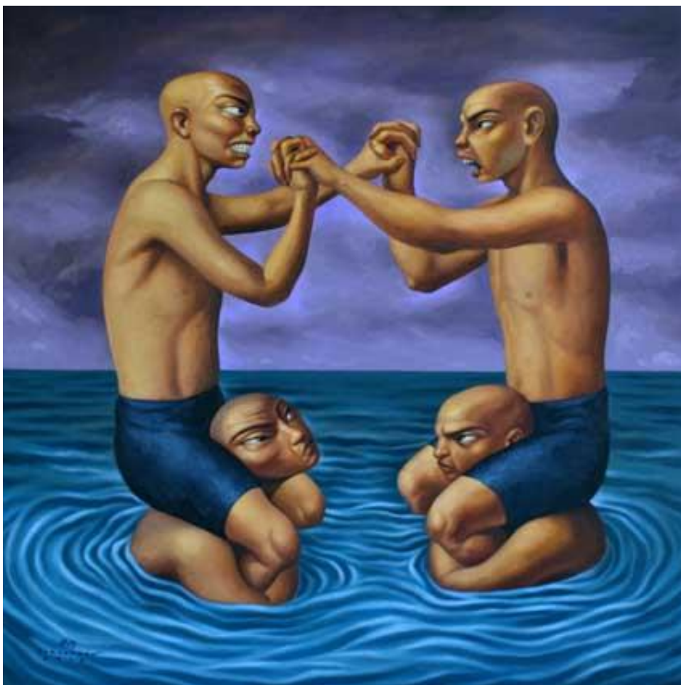
Elmer Borlongan, Chicken fight (Shoulder Wars), oil on canvas, 2012