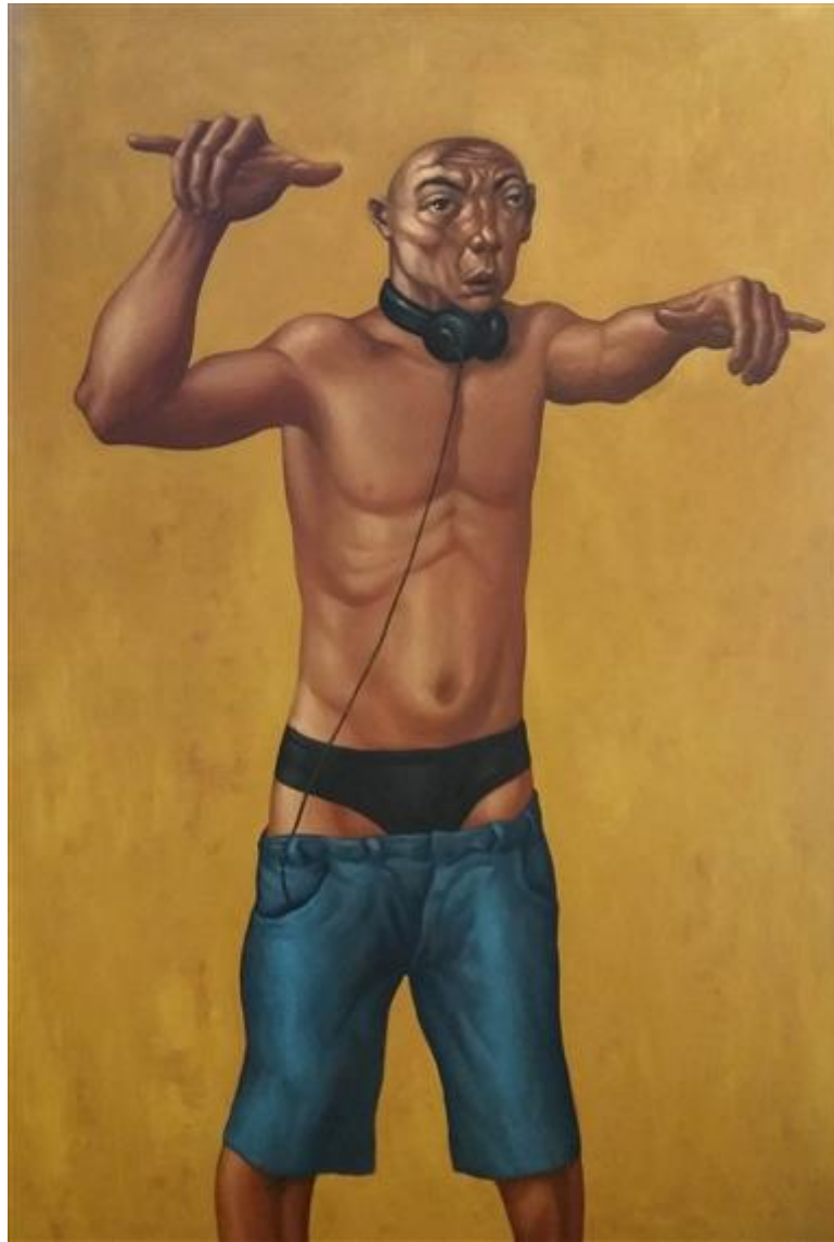
Elmer Borlongan, Hang Loose, oil on canvas, 2014