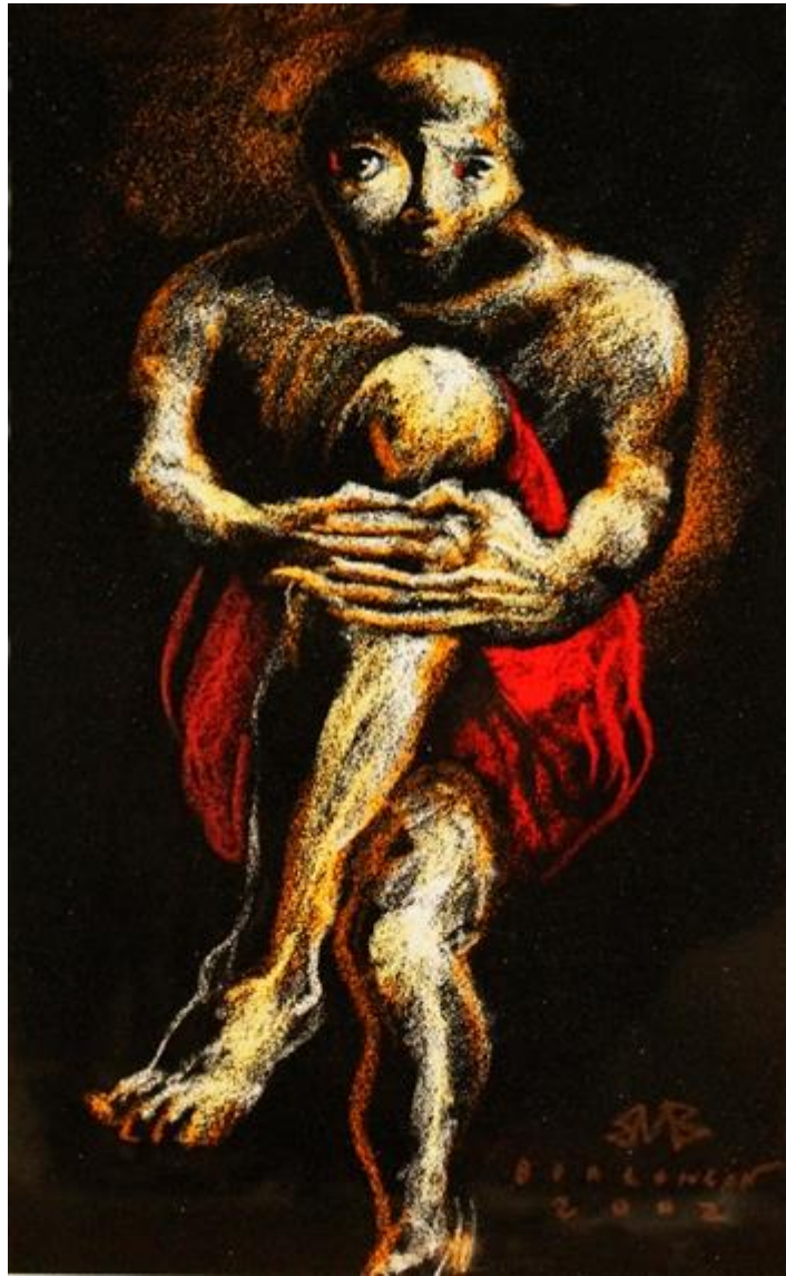
Elmer Borlongan, Untitled, pastel on felt paper, 2002