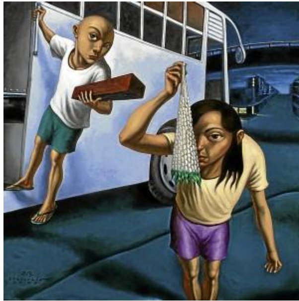
Elmer Borlongan, Batang Edsa, oil on canvas 2011