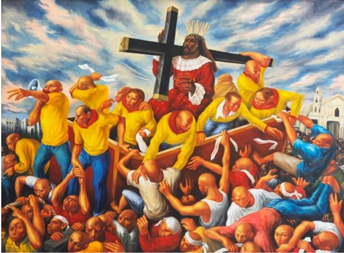
Elmer Borlongan, Quiapo, oil on canvas, 2004