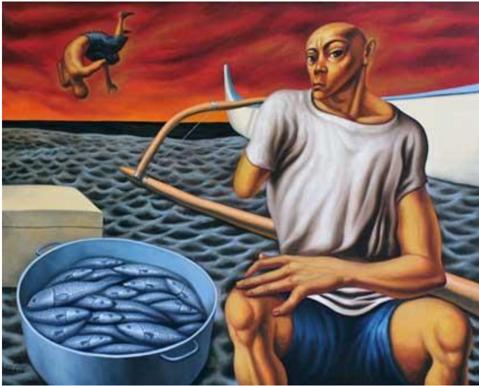
Elmer Borlongan, Dynamite kid, oil on canvas, 2012