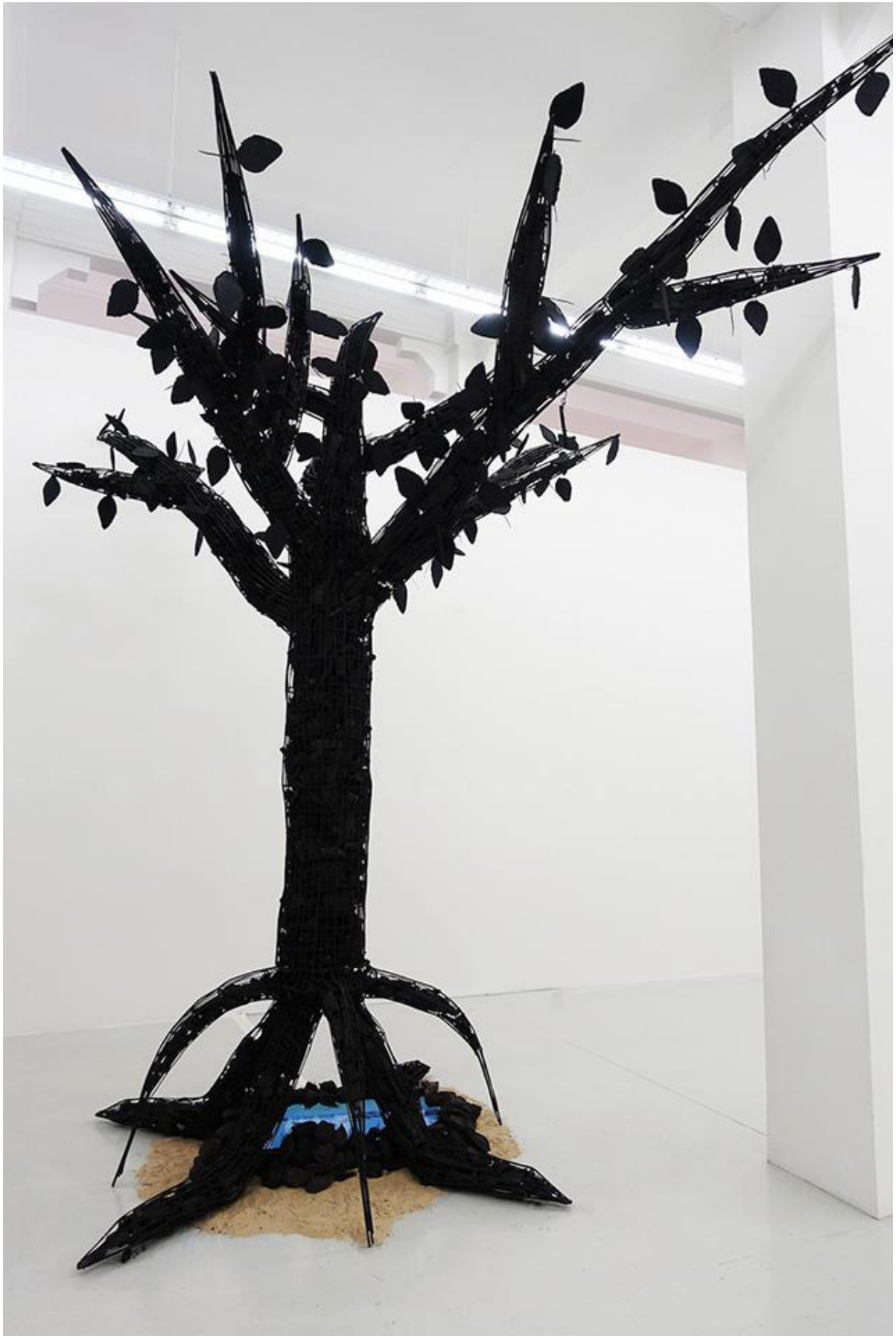
Htein Lin, 'Mangrove I', iron, charcoal, sand, mangrove seeds, video screen, 2016, Yavuz Gallery