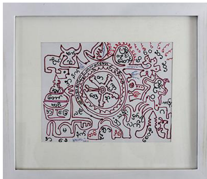
Htein Lin, Painting Poem 6, work on paper