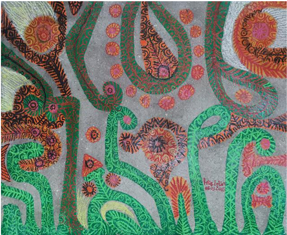
Htein Lin, Recycled Acrylic on recycled cardboard, 2015, River Gallery