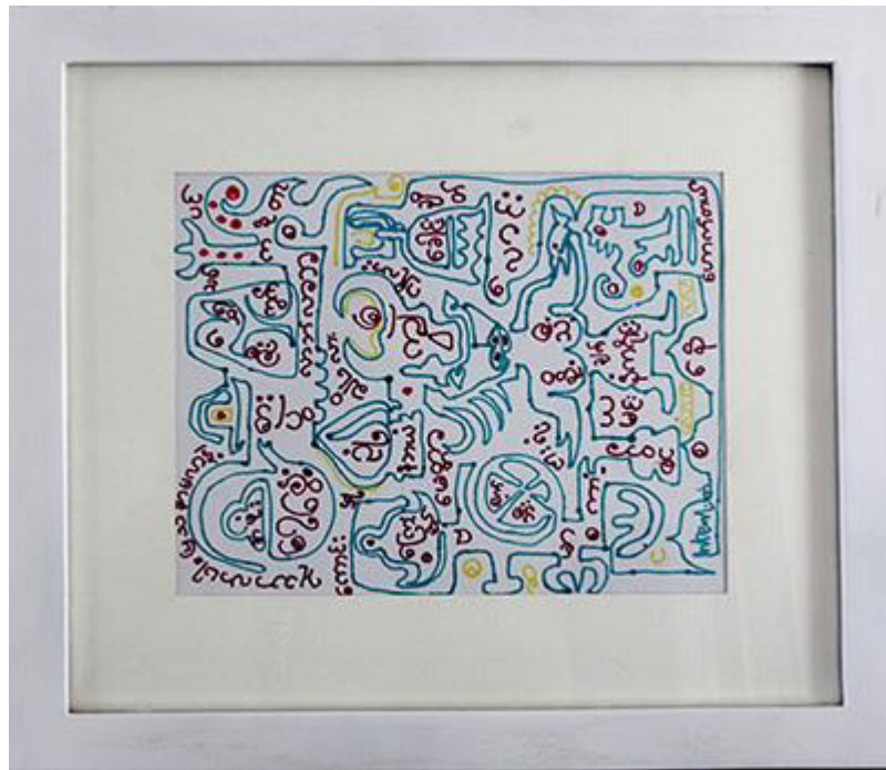
Htein Lin, Painting poem 4 , work on paper