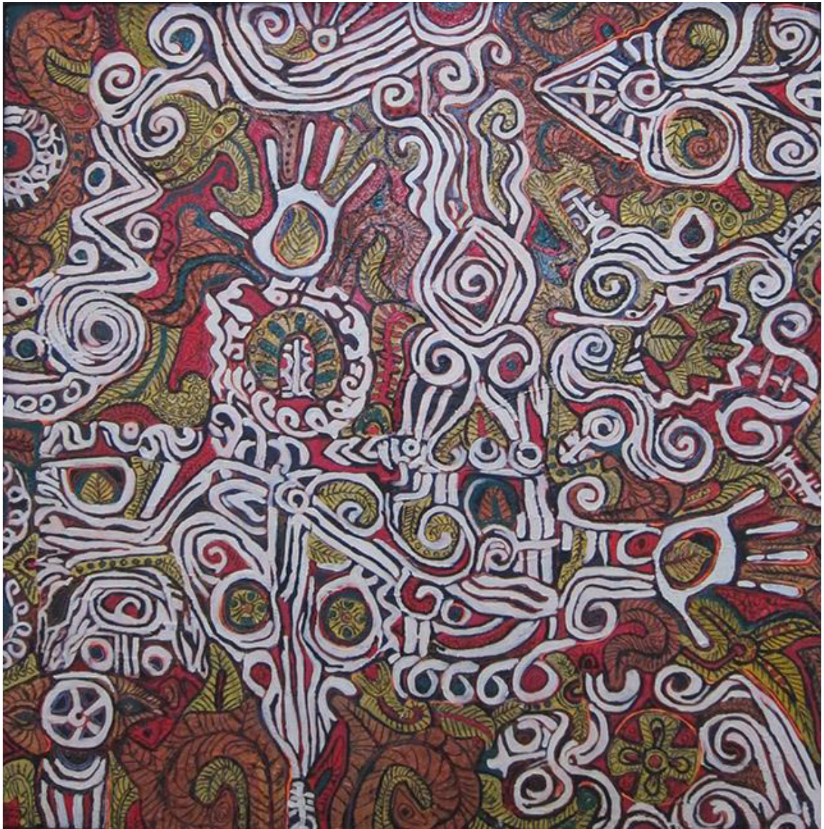
Htein Lin, Burma Chorus, acrylic on canvas, 2016, River Gallery