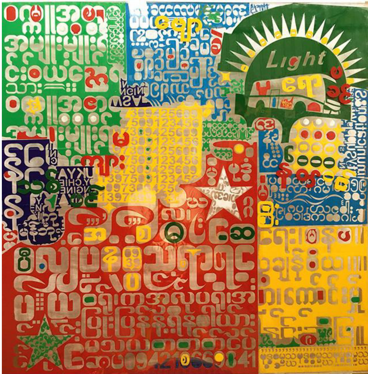
Htein Lin, Signs of The Times 5, acrylic on acrylic sheet, 2016, River Gallery