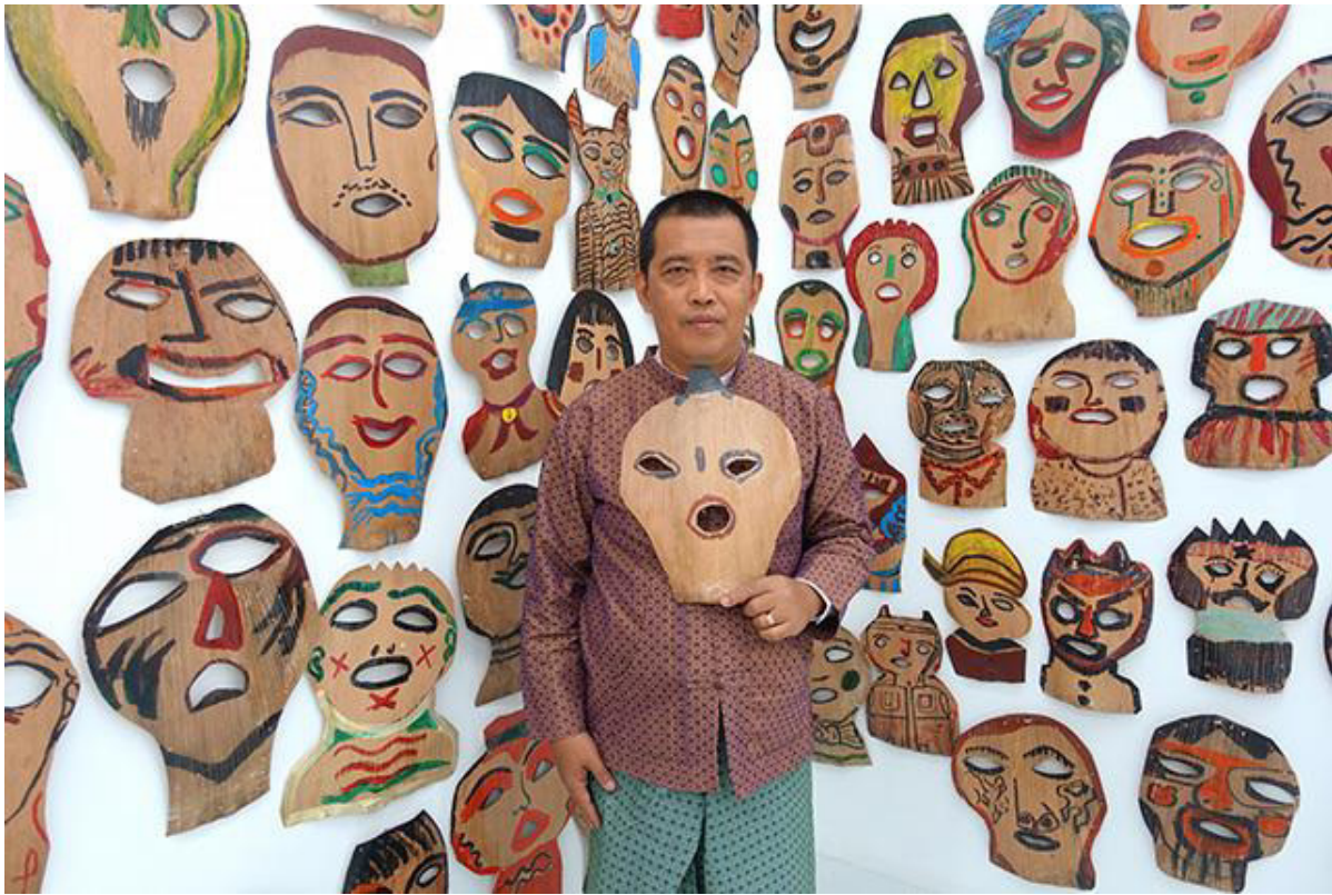
Htein Lin