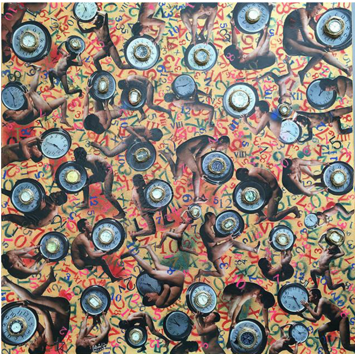
Htein Lin, Clockwork Mixed-Media, 2009, River Gallery