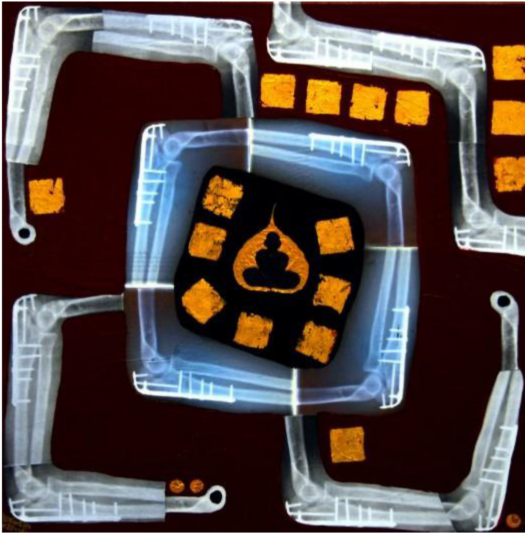
Htein Lin, self-portrait, acrylic and collage on canvas, 2008