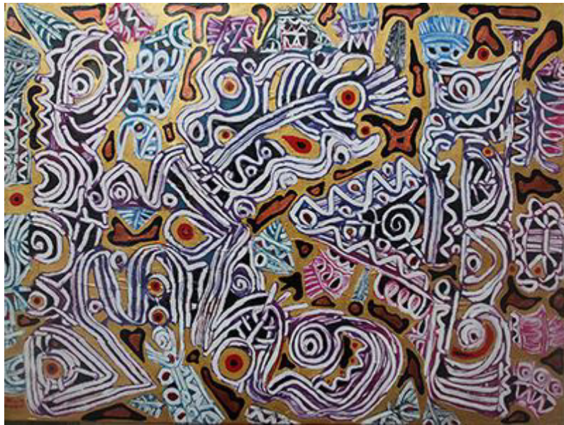
Htein Lin, Resource Curse, acrylic on canvas, 2015

HTEIN LIN est un artiste contemporain birman très reconnu dans son pays et à l'étranger. Il réalise peinture, vidéo, installations et performances. Il a été également acteur.