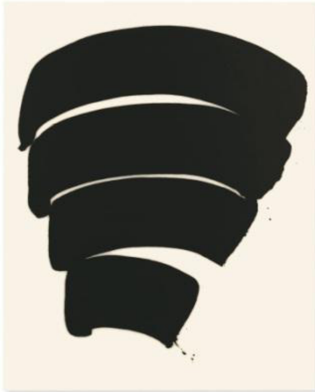
Lee Bae, acrylic medium, charcoal black on canvas, 2016 © Lee Bae