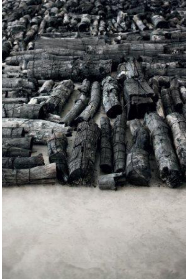
Lee Bae, Landscape, Burnt tree trunks installation Daegu Art Museum, Korea, 2014 © Lee Bae