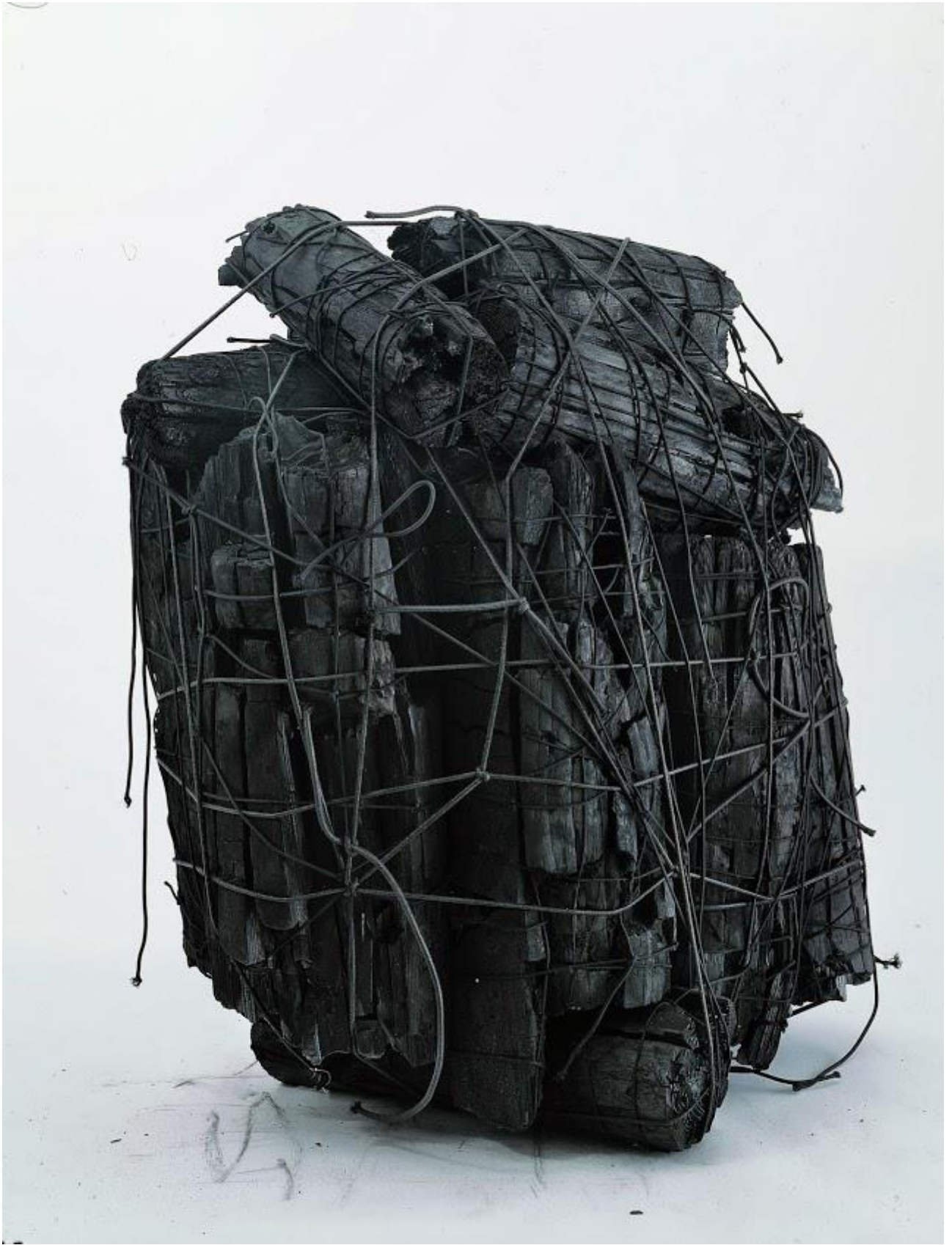
Lee Bae, Issu du Feu , charcoal mass and black elastic string, 2000