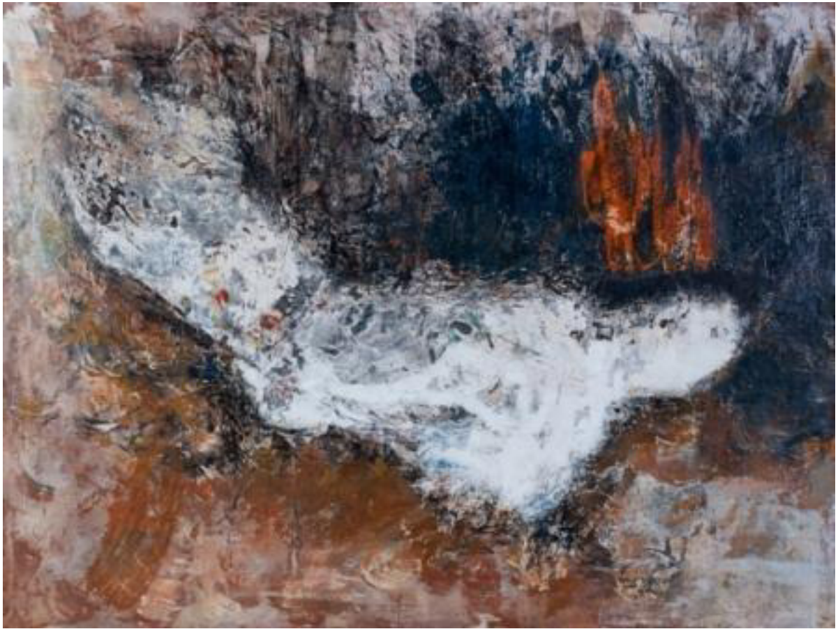
Lee Bae, Untitled, oil on canvas, 1990