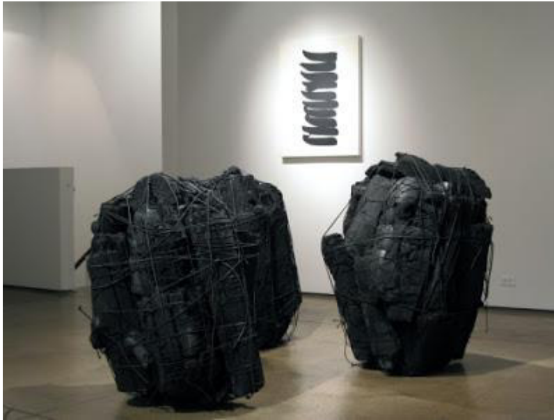
Lee Bae, Installation view sculpture, charcoal, 2011, Nicholas Robinson Gallery

Lee Bae est parmi les plus grands artistes internationaux coréens. Il est connu pour ses peintures monochromes de couleur noir. En 2011, il est nommé artiste de l'année 1995-2010 par le National Museum of Contemporary Art, Gwacheon, Corée du Sud. Le 10 décembre 2013, il reçoit le prix de l'Association nationale des critiques d'art de Corée du Sud.