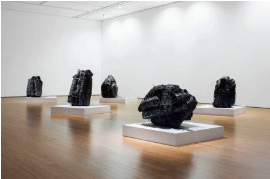
Lee Bae, charcoal mass and black elastic string Installation Daegu Art Museum, Korea, 2014