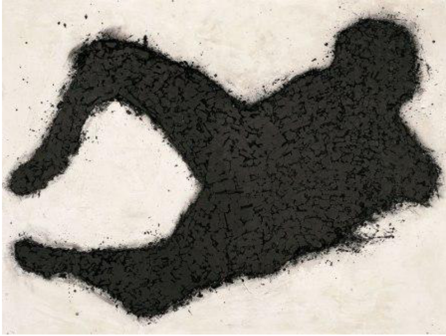
Lee Bae, Body, charcoal on canvas, 1992