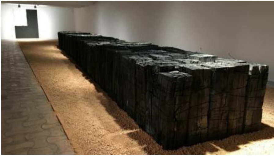
Lee Bae, charcoal blocs, exhibition 'Plus de Lumière', Fondation Maeght, 2018