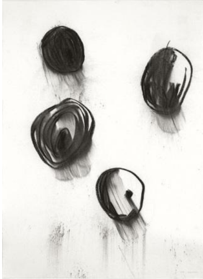
Lee Bae, Drawing, charcoal on paper, 2014 © Lee Bae