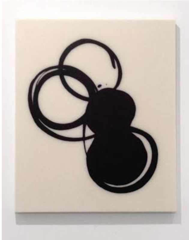
Lee Bae, Installation view, charcoal on canvas, 2011 Nicholas Robinson Gallery