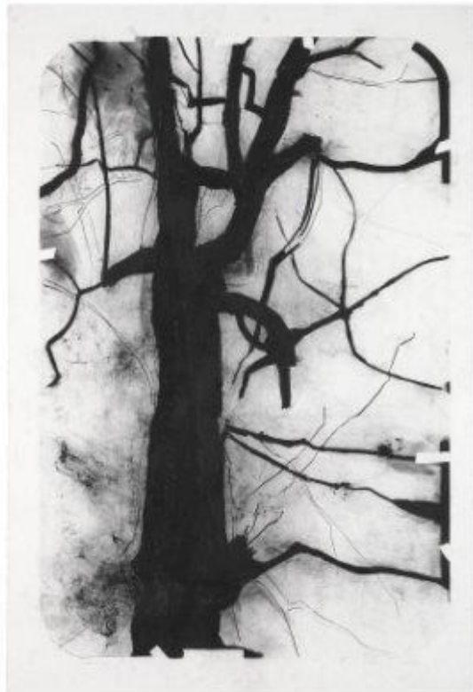
Lee Bae, Drawing, charcoal on paper © Lee Bae 1997