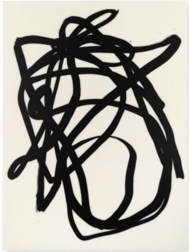
Lee Bae, acrylic medium, charcoal black on canvas, 2015 © Lee Bae