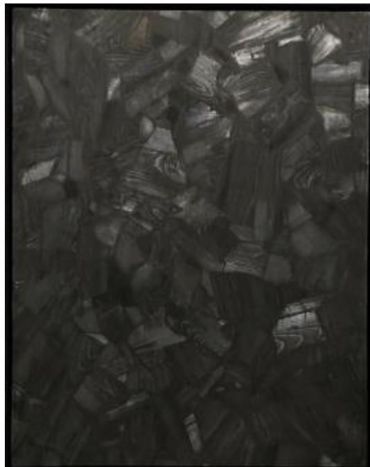
Lee Bae, Issu du Feu, charcoal on canvas, 2001