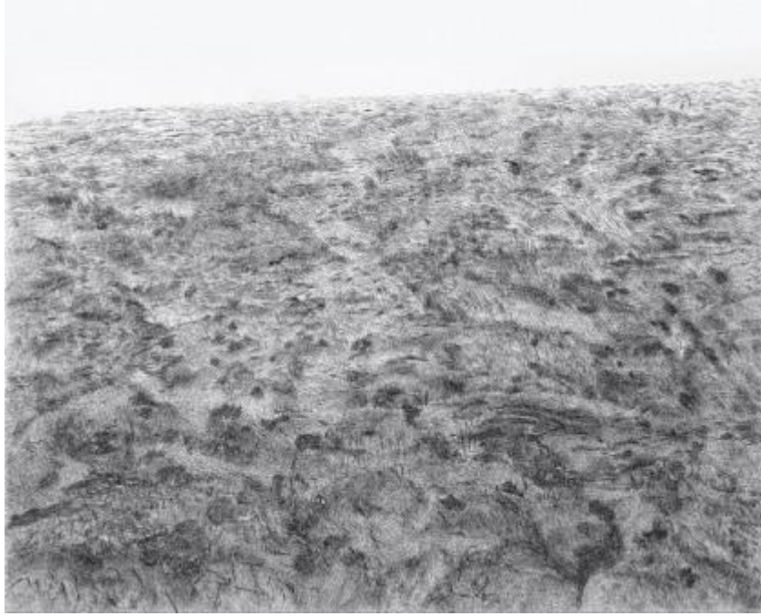
Lee Bae, Landscape, staples on canvas, 1998, © Lee Bae