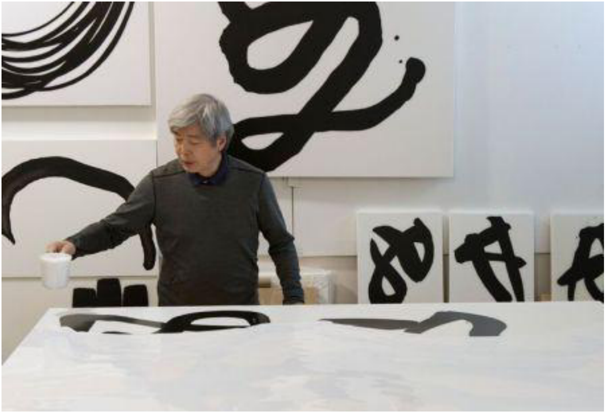
Lee Bae