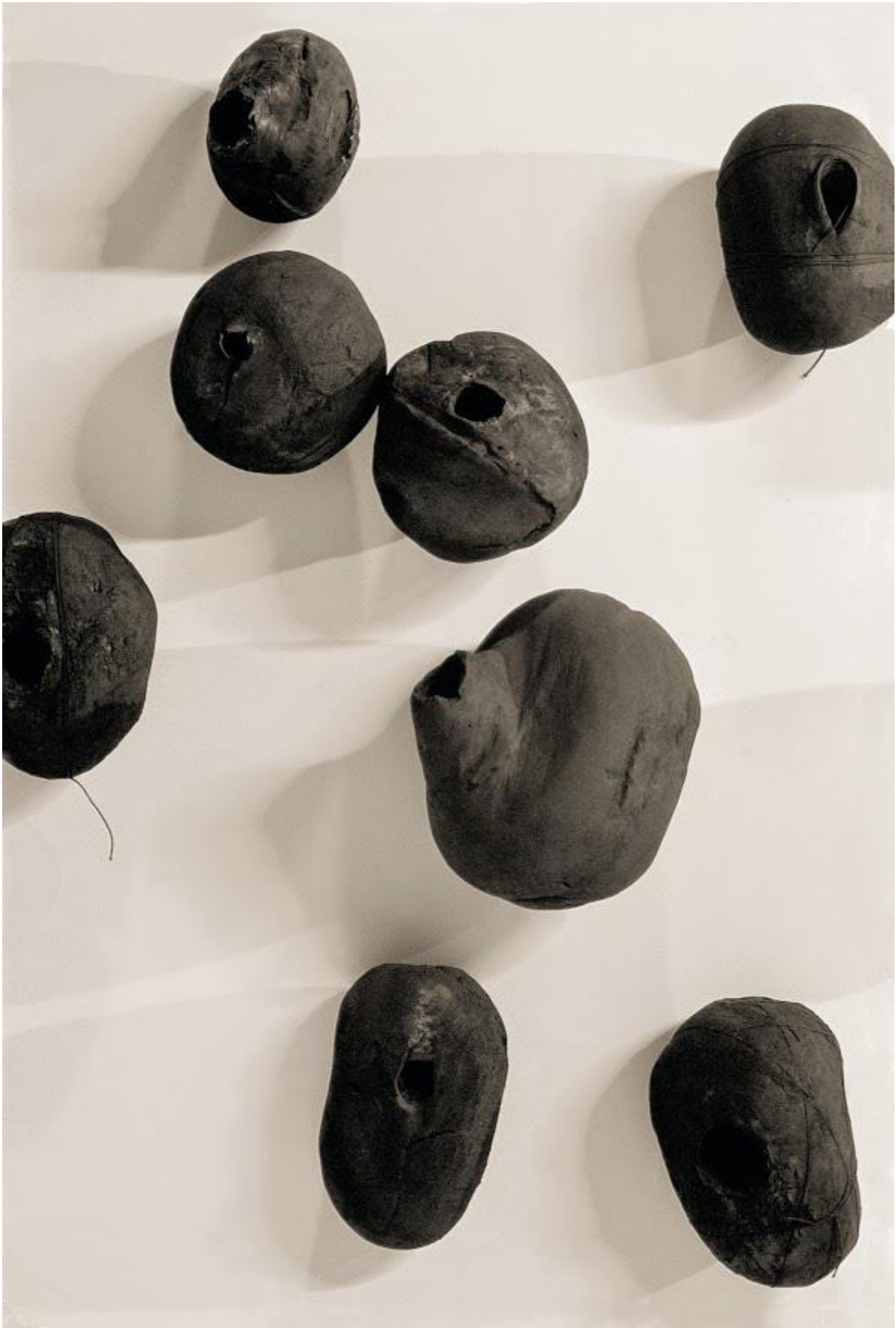
Lee Bae, Issue du feu, wood charcoal, 1997 Courtesy fondation Fernet-Branca Lee Bae