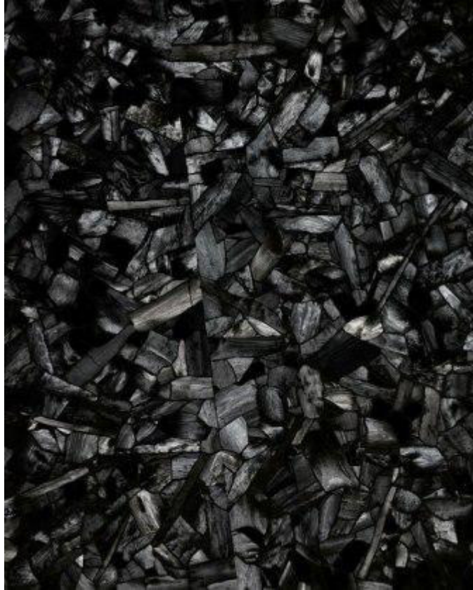
Lee Bae, Issu du feu, charcoal on canvas, 2000 © Lee Bae