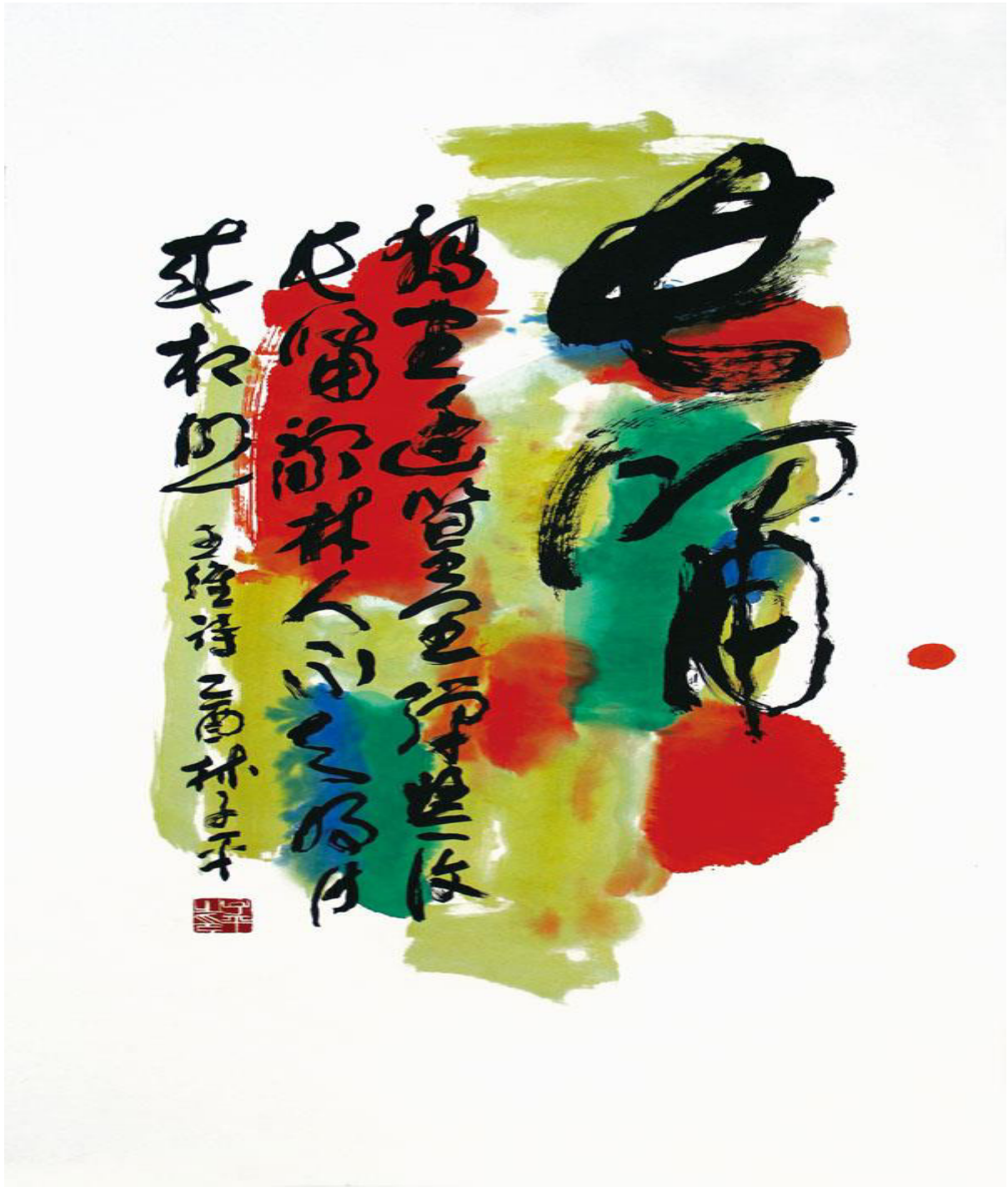
Lim Tze Peng, Abstract calligraphy