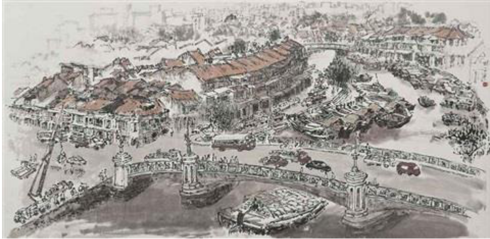
Lim Tze Peng, Singapore river scene, ink and gouache on paper,1978