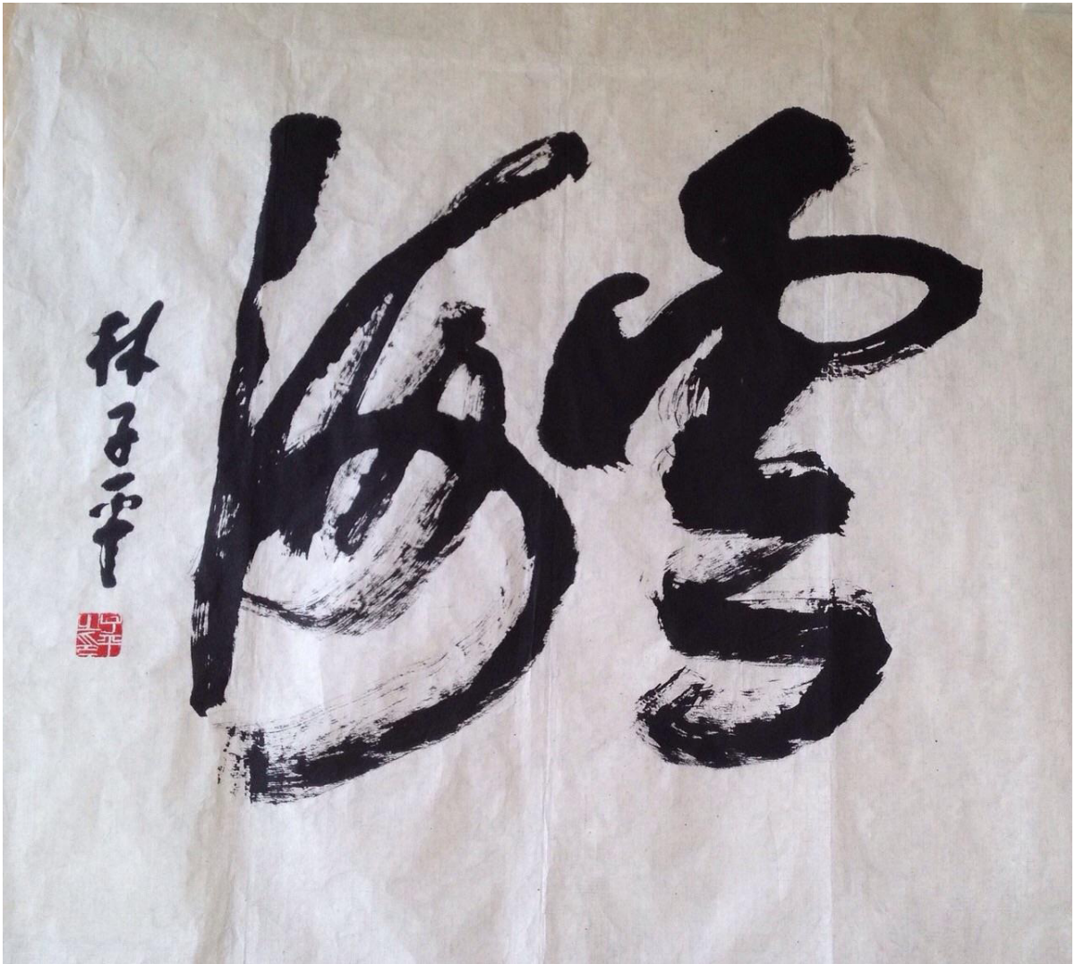
Lim Tze Peng, Calligraphy II, Chinese ink & color on rice paper, 2012