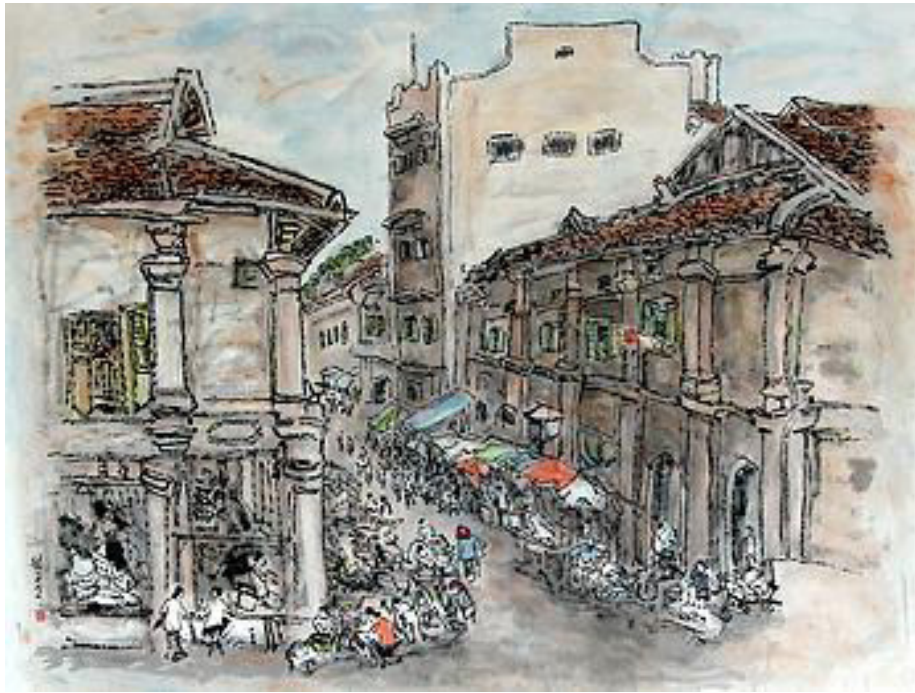
Lim Tze Peng, Street scene, Singapour, ink and colour on paper, 2007