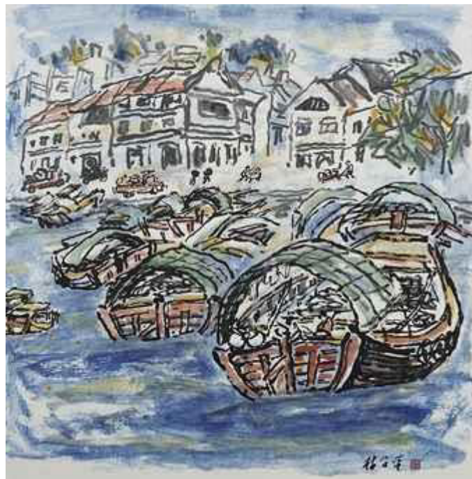
Lim Tze Peng, Singapore rivers scene, ink and gouache on paper, 1980