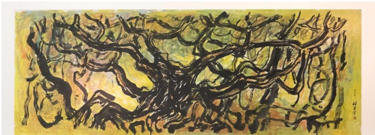
Lim Tze Peng, Trees, ink and water on paper, 2014