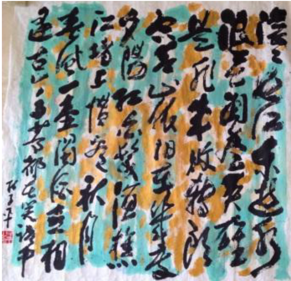
Lim Tze Peng, Calligraphy Green and Gold II Chinese Ink and color on rice paper, 2014