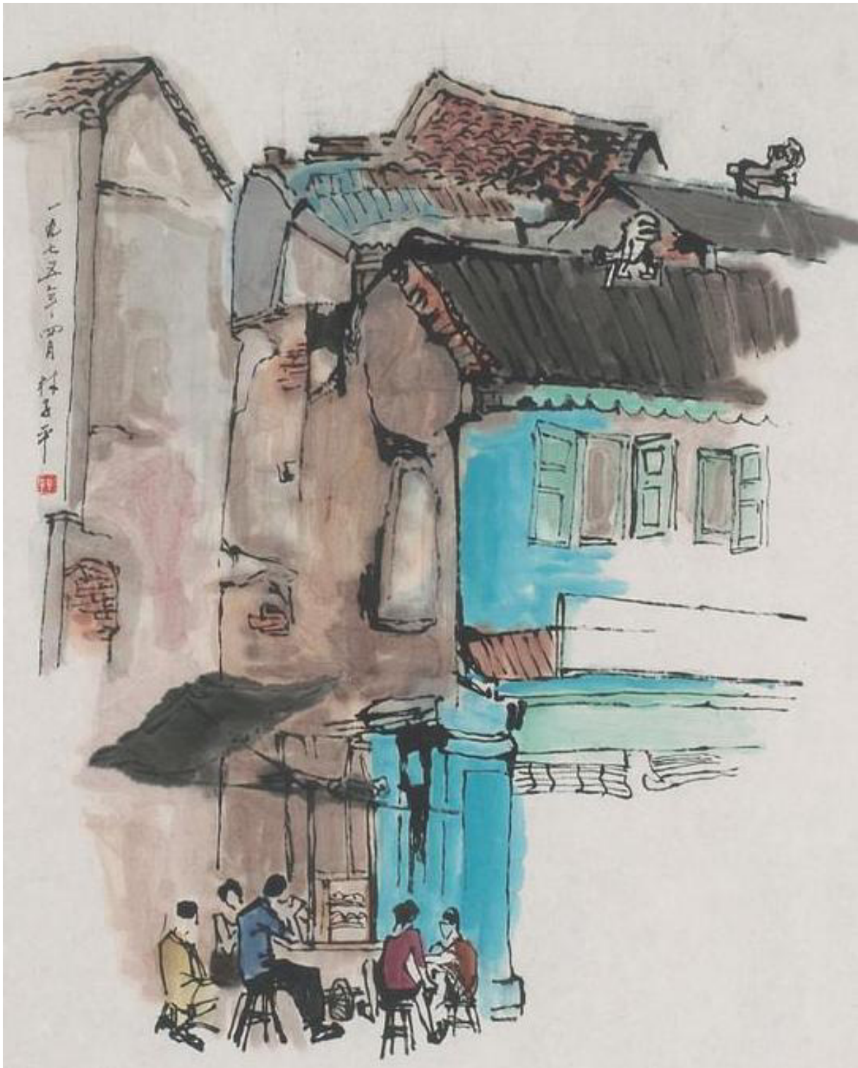
Lim Tze Peng, Junction Circular Canton Road, 1975