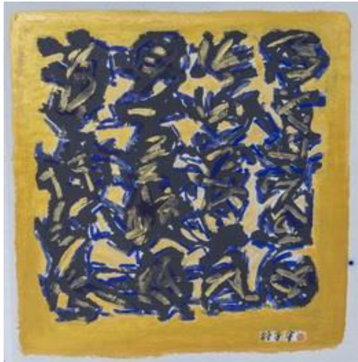
Lim Tze Peng, Abstract calligraphy, ink and colour on rice paper