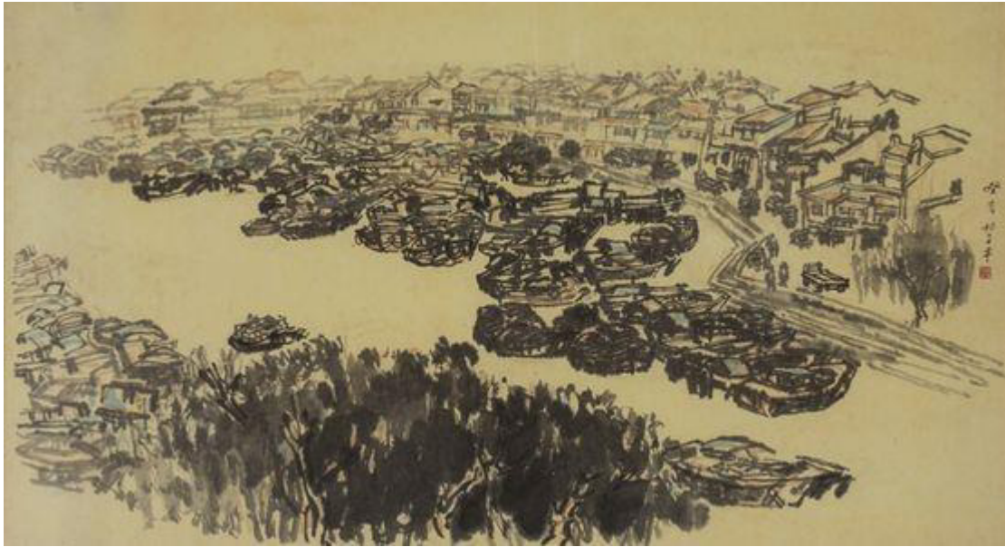
Lim Tze Peng, Singapore river, ink and colour on paper

LIM TZE PENG est un des artistes les plus reconnus à Singapour. Il est célèbre pour ses dessins à l'encre de Chine où il excelle et ses peintures d'après l'indépendance de Singapour.