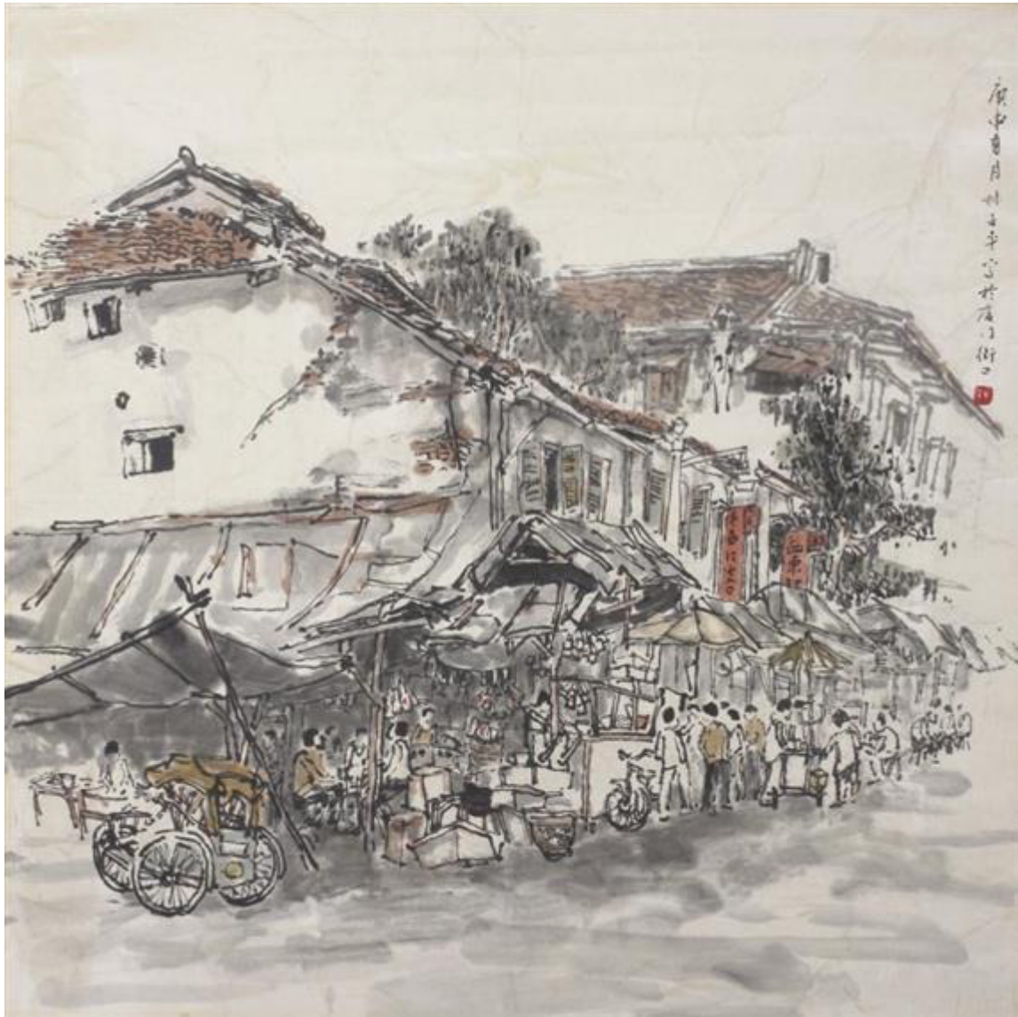
Lim Tze Peng, Amoy street, ink and watercolor on paper