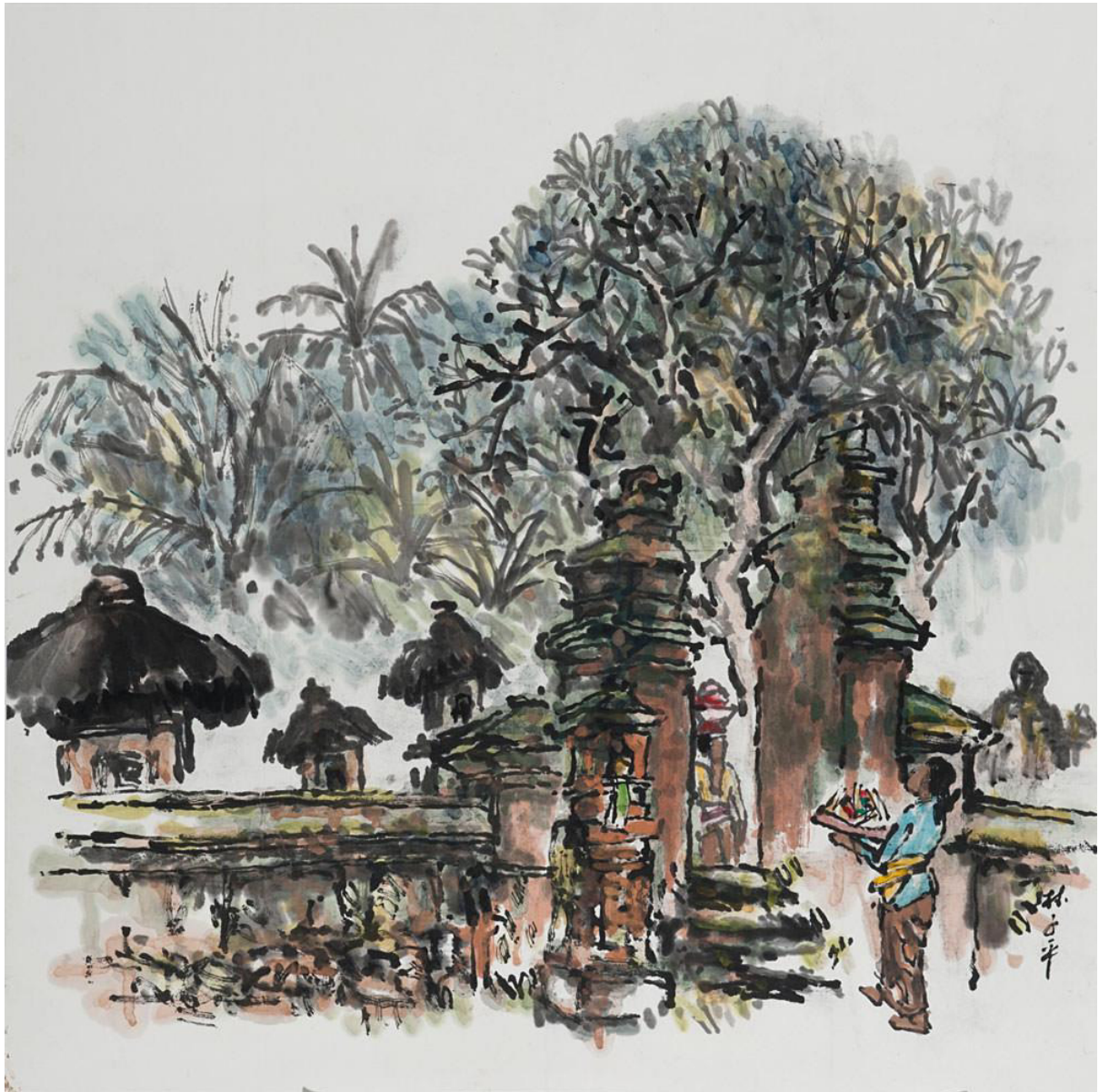
Lim Tze Peng, Bali temple Series, ink and colour on paper, 1989