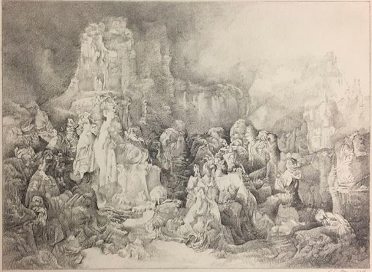
Liu Dan, Reimagining the Lystra Scene, ink on paper, 2016