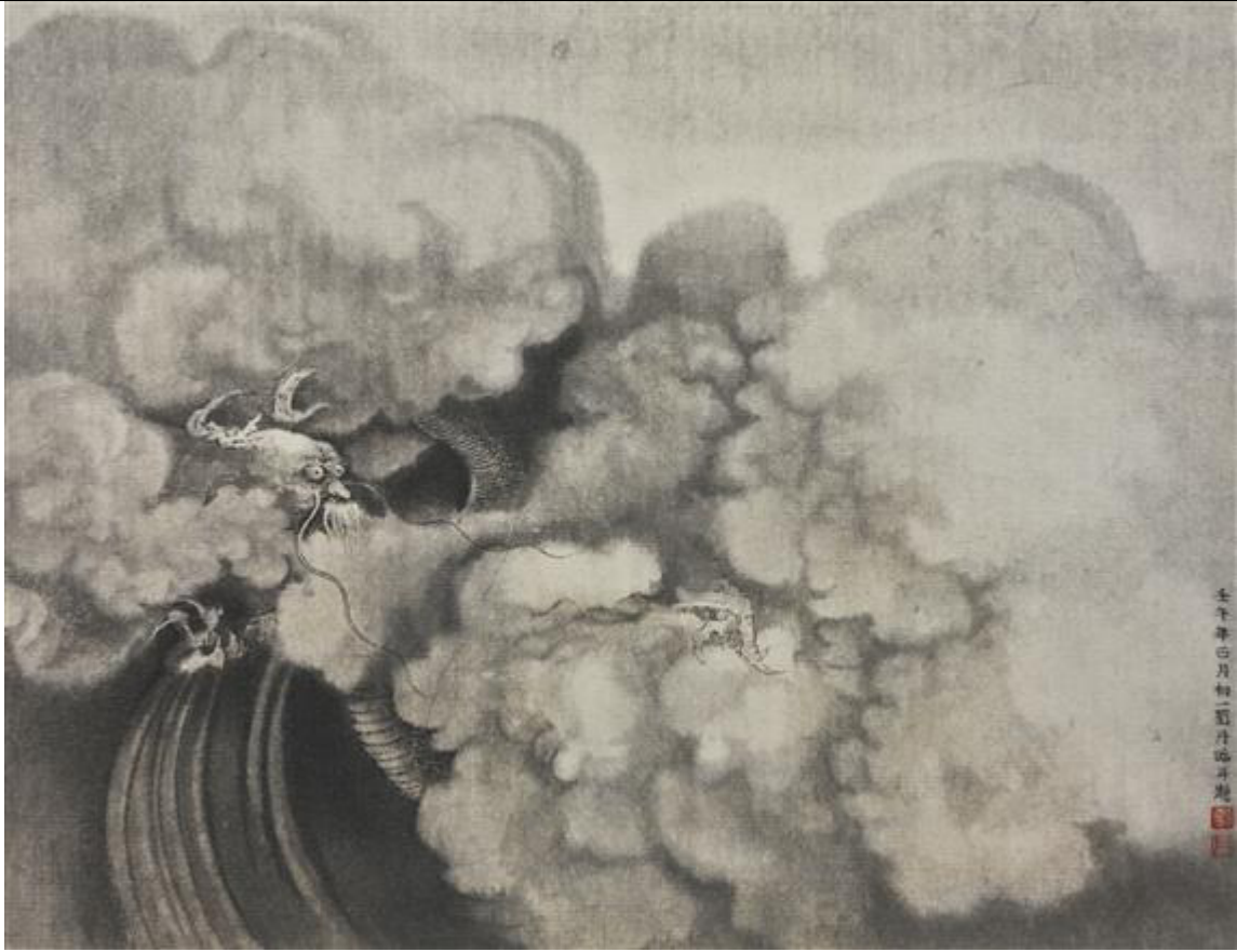
Liu Dan, Dragon after CHen Rong, ink on paper, 2002