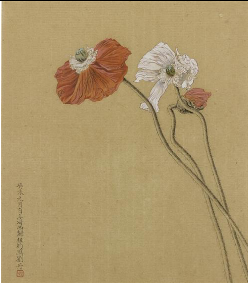
Liu Dan, Poppies, ink and colour on paper, 2003