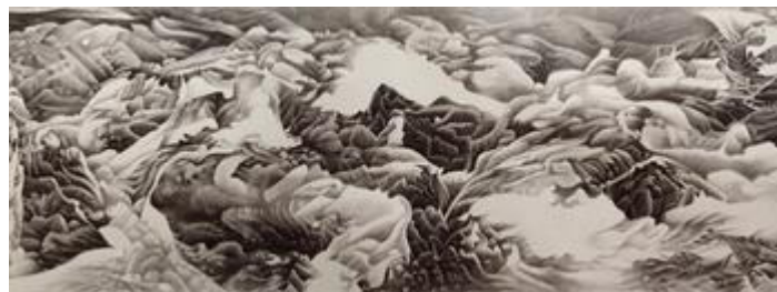
Liu Dan, Wawes, ink-handscroll, 1990