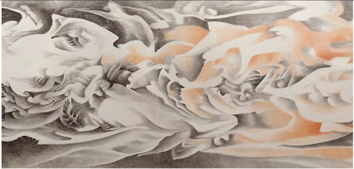
Liu Dan, Ink Handscroll, Met Museum, 1990