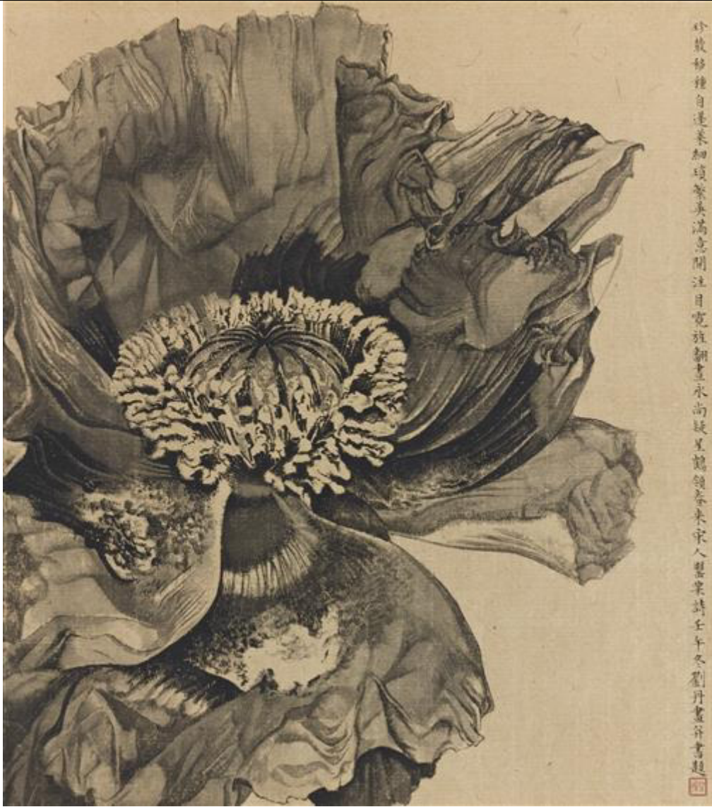
Liu Dan Poppy, ink on paper, 2002