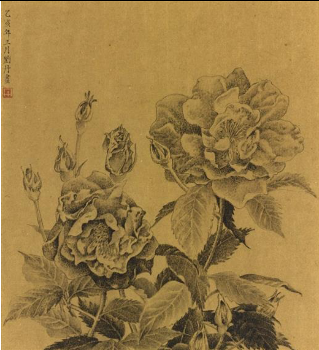
Liu Dan, Bouquet de roses, ink on paper, 1995