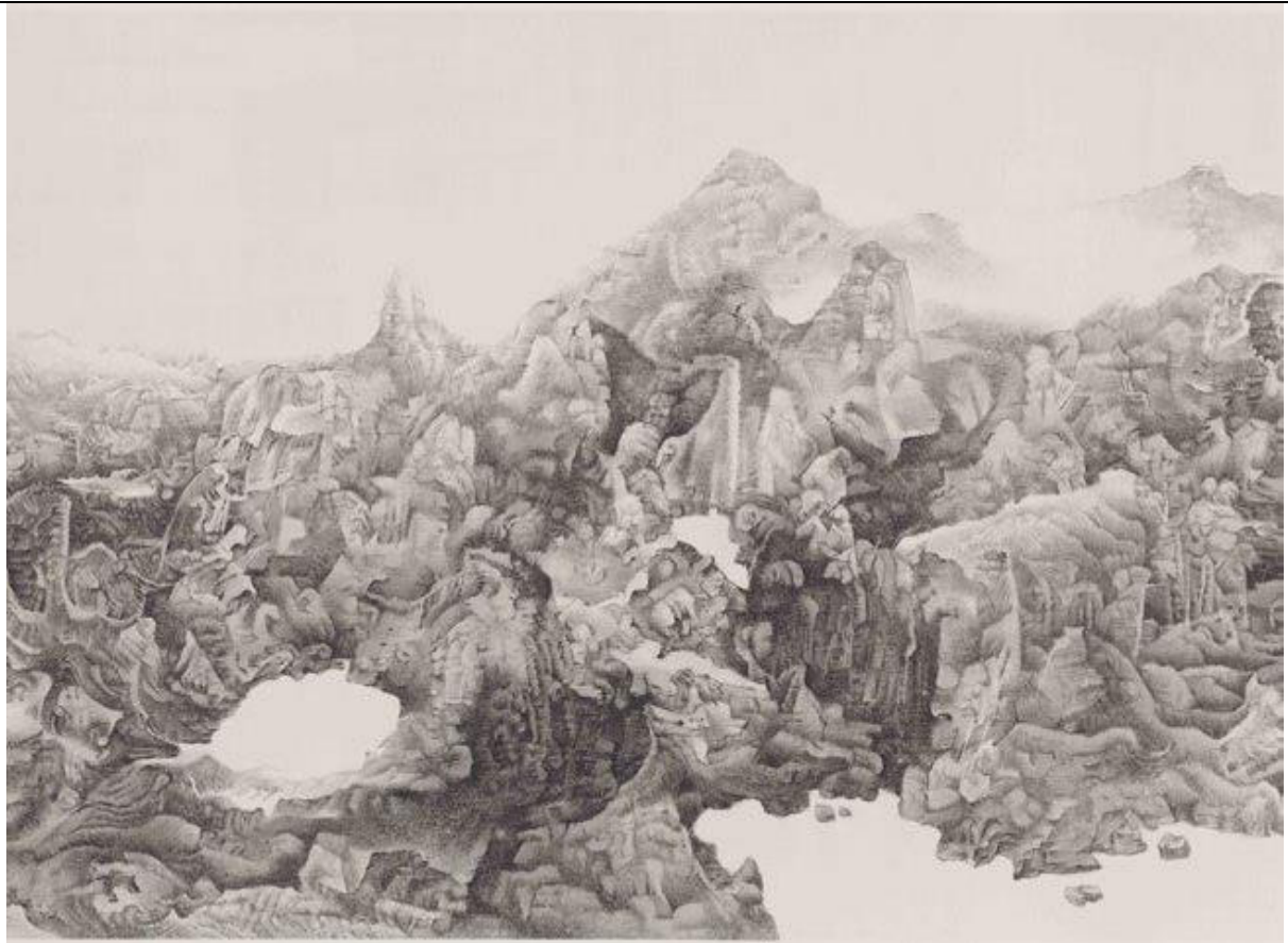
Liu Dan Mingsha-Diablo, ink on paper, 2013, Xilling collection