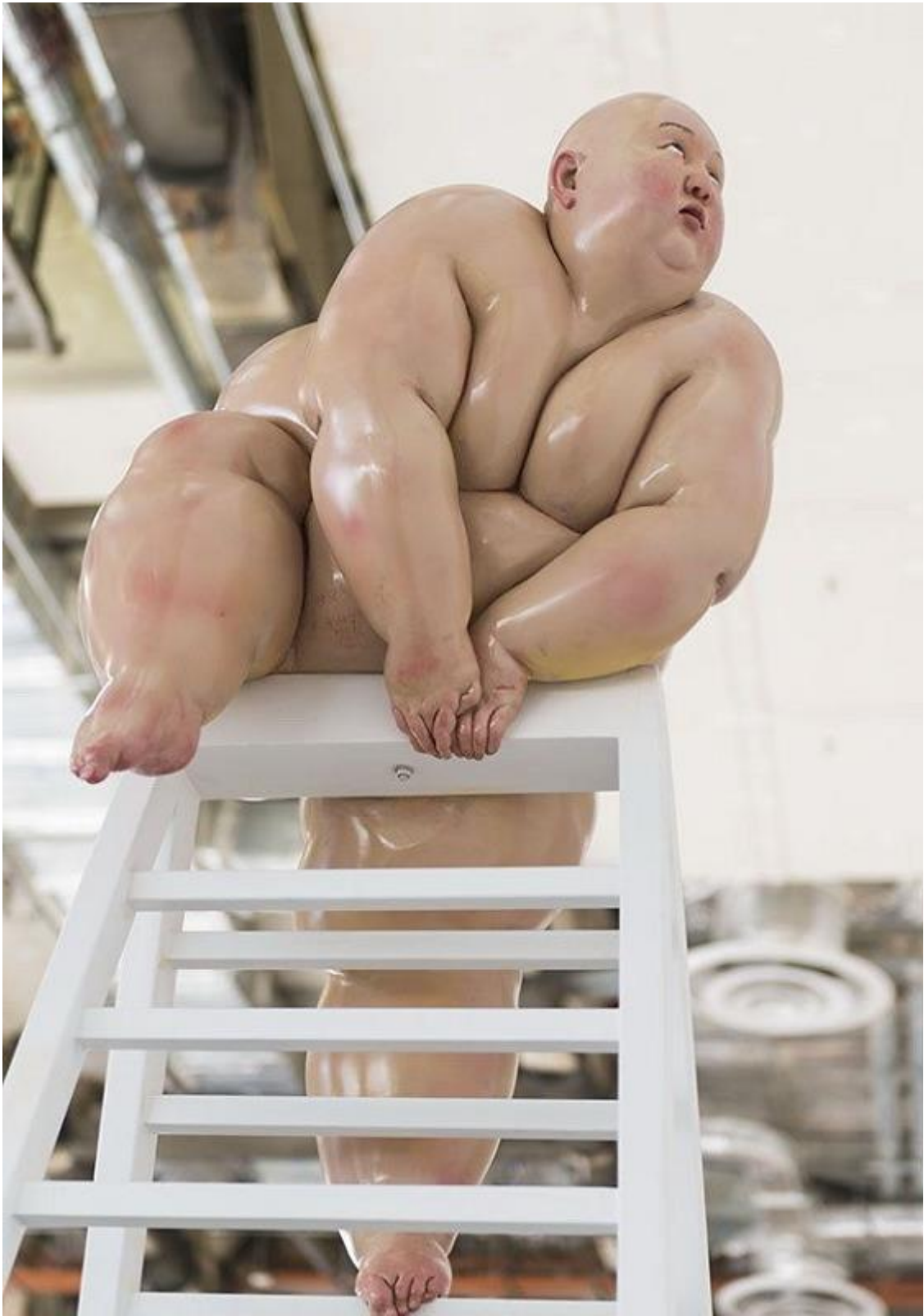
Mu Boyan, "Fix", color on resin, 2013