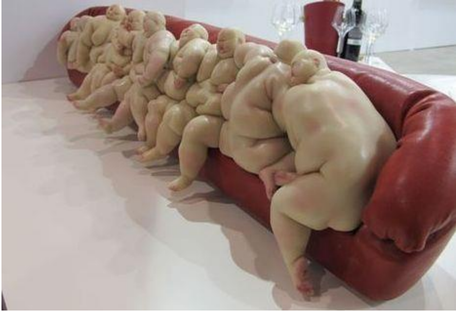
Mu Boyan, sofa II, color on resin, 2011