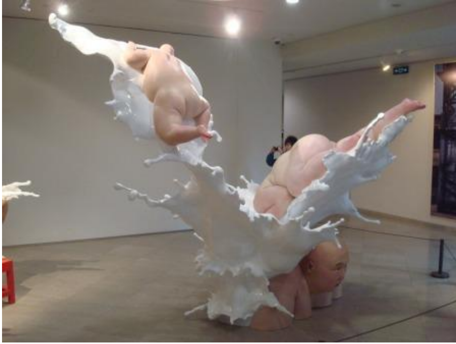
Mu Boyan, Fat series, color on resin, sculpture, 2010