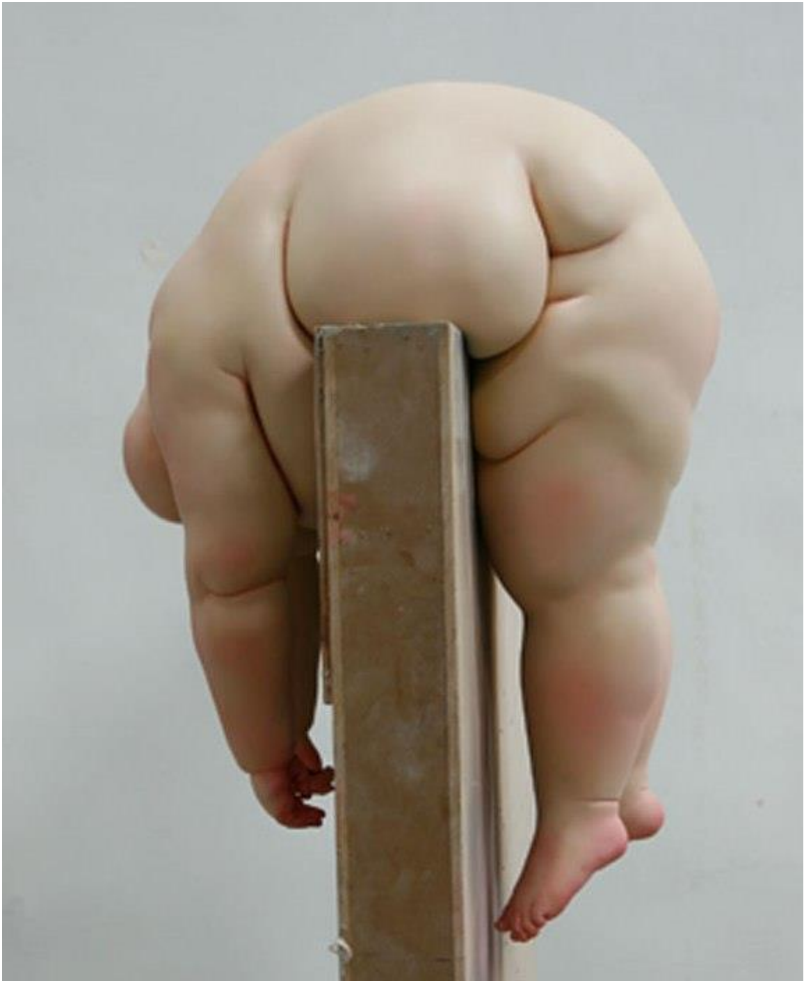
Mu Boyan, Sunny, painted on resin, 2011