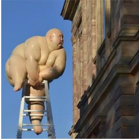
Mu Boyan, "Fix", 2013