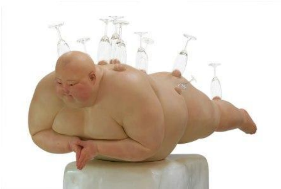
Mu Boyan I know but... color on resin, 2008