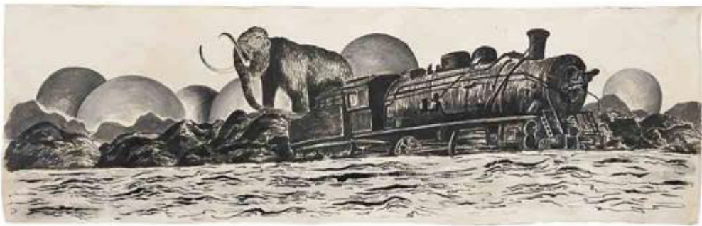
Mythological Time by Sun Xun, Guggenheim Museum, 2016