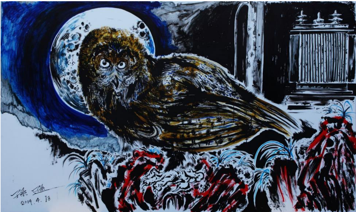
Time Vivarium by Sun Xun, 2014, acrylic and ink on paper mounted to aluminium, Sean Kelly Gallery