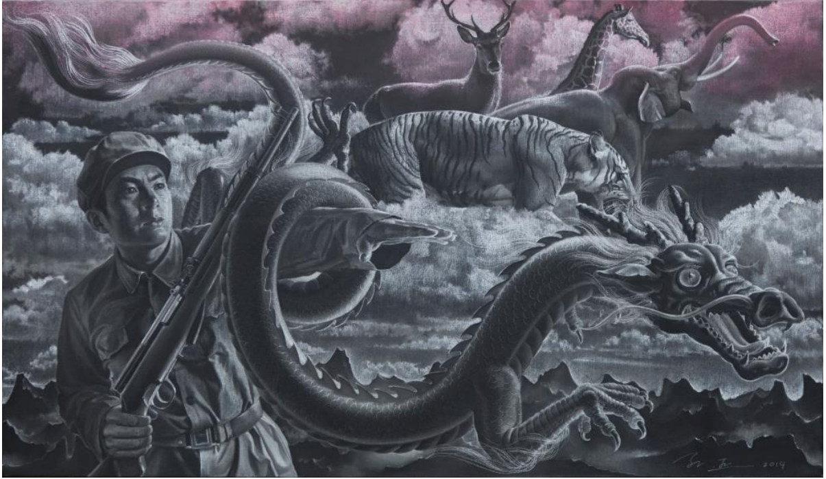
Sometimes memories does lie, by Sun Xun, pastel on canvas, 2014