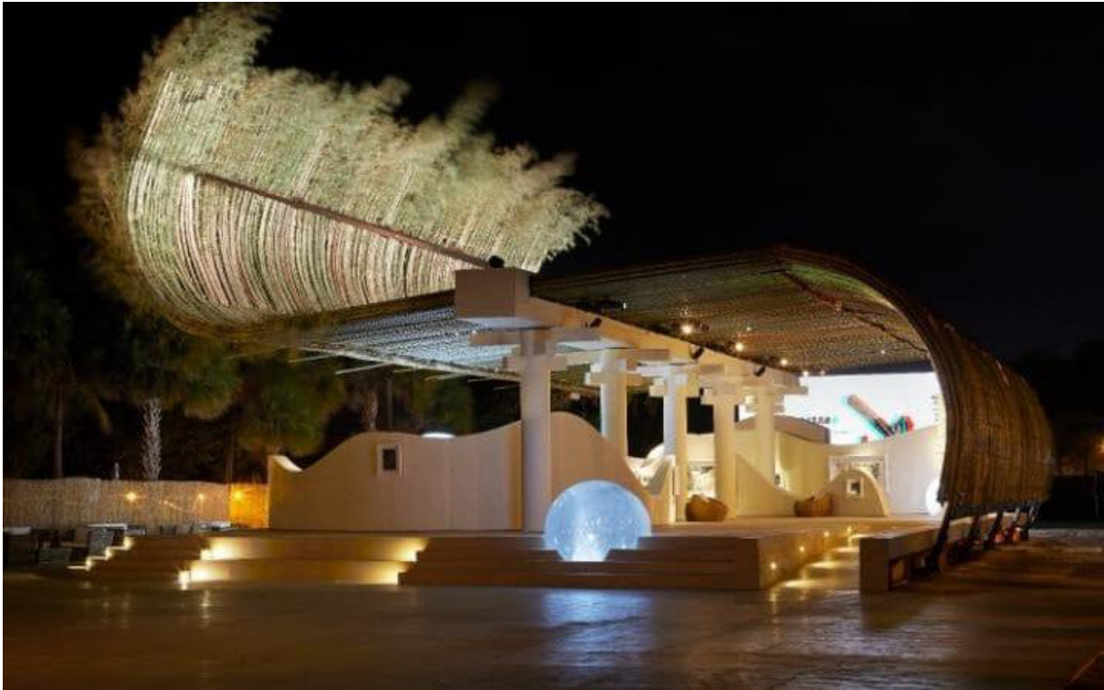
'Reconstruction of the Universe' by Sun Xun for the Audemars Piguet Art Commission